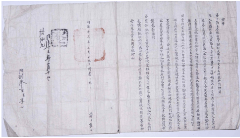
【사료 1】 1874년 예조계목