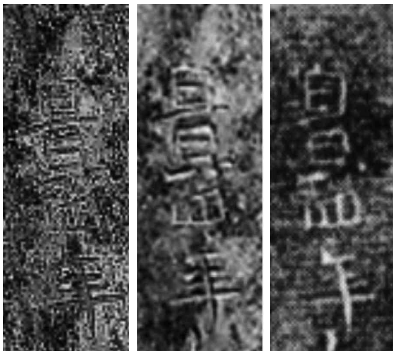
(인터넷자료) 삼성미술 관 리움 (인터넷자료) 한국금석문 종합영상정보시스템 황수영, 1985, 『韓國金石 遺文』, 일지사

것이 타당해 보인다. 한편 글자의 앞뒤로 마멸된 글자를 상정하는 의견도 따르기 어려운데, 사진 상으로 보았을 때 ‘景’으로 판독되는 글자 앞뒤에 다른 글자가 들어갈 공간적 여유는 없고 글자가 마멸된 흔적도 찾을 수 없다.