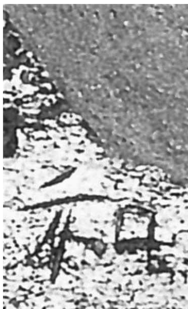
국립중앙박물관, 2006, 『북녘의 문화유산』

이 확인되는데, 『신당서』 발해전에 전하는 발해의 연호 가운데 '㉚和'에 대응하는 연호는 발해 11대 왕 大彝震의 치세(830~857) 기간에 사용된 '咸和'가 유일하다. 그러나 咸和 시기의 병인년은 846년으로 이는 咸和 17년에 해당된다. 따라서 咸和는 명문의 '㉚和三年'에 대응하지 않는다. 그리고 발해의 12대 왕 大虔晃의 시대부터 멸망기까지, 즉 857년 이후로부터는 연호가 전하지 않는데, 그 이후로 丙寅년이 돌아오는 해는 906년이다. 그런데 906년은 14대 대위해 치세(895~906?·907?)의 말년으로서 이 역시 '㉚和三年'에는 해당하지 않을 것으로 보인다. 따라서 명문의 '㉚和' 연호는 발해의 연호일 가능성은 없다. 한편 '㉚和'가 중국 왕조의 연