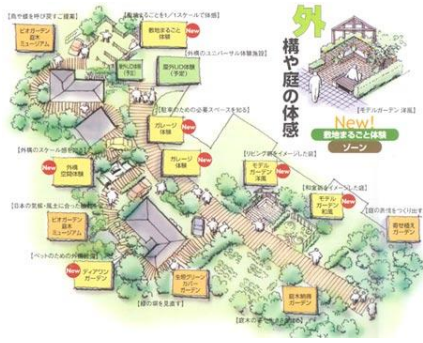
그림 9. 부지체험안내도