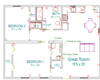
그림 11. 평면

또한 IT시스템의 적극적인 활용으로 주택내부를 전체적으로 조정하고 감시한다. 에너지 관리는 원격으로 조절되는 온도장치, 전등, 난방기 등으로 하고 있으며 비디오 모니터링과 화재경보를 통해 안전과 보안을 강화하였다. 또한 'Cyber nurse'를 통해 매일매일 인터넷으로 거주자의 건강을 관리한다. 이 프로젝트는 건축 공간, IT시스템의 활용뿐만 아니라 지역 전체를 자립생활이 가능한 시범지역으로 조성하기 위한 연구를 지속적으로 하고 있으며, 대학과 연계하여 학생들의 교육 및 인식개선을 위한 사업도 실시하고 있다.