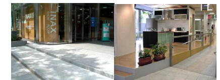
그림 4. 쇼룸의 입구

INAX는 주택뿐만 아니라 숙박시설, 병원, 음식점 등 시설의 배리어 프리에 대해서도 연구를 하며 개조를 해주고 있다. 또한 E-쇼룸과 쇼룸의 운영으로 일반인들의 인식 개선과 교육을 하고 있다. 연구소내의 유니버설 디자인관련 연구팀은 장애인 및 노약자의 행동 특성 및 치수에 대한 연구를 통해 최소의 공간에서 효율적인 기능을 하는 제품을 개발하고 있으며, 주택개조사업 등을 소개해주고 상담을 통해 실제 주택개조를 원하는 사람에게 실질적인 정보를 제공해 주고 있다.