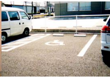
그림 7. 쇼룸의 주차장