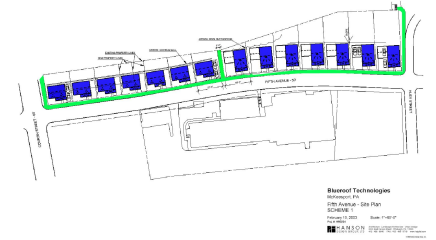
그림 16. Bluerooft Technologies의 노인주택프로젝트 마을 배치도

Bluerooft Technologies의 노인주택 프로젝트는 노인들을 위한 시범주택으로 개발된 사례로서 단순히 주택에만 국한된 것이 아니라 마을에서 노인주거의 적절한 입지에 대한 논의가 이루어진 프로젝트이다. 한 예로 노인들이 건강상 위급한 상황이 닥쳤을 경우 인근에 의료시설이 입지해 있는 것이 유리하다는 것을 들 수 있다. 운영방식은 단위주택만이 아니라 마을 단위로 시범적인 사업을 진행하고 장애인 및 노약자를 대상으로 건축, IT기술, 로봇기술 등 장애인 및 노약자가 독립적인 자립생활이 가능한 모든 기술요소를 개발하는데 목적이 있다. 무장애 공간 및 거주자의 안전과 자립생활을 영위 할 수 있도록 정보 제공을 위한 IT기술을 연구하고 있다. 기술적인 측면에서 각 유닛별로 노인들의 라이프스타일에 맞는 IT시스템을 적용 하고 실제 노인들을 거주케 하여 연구의 성과를 검증하고 평가하여 좀 더 나은 기술 개발을 위한 테스트베드로 사용하고 있다. 그러나 기술 내 시설의 적절한 입지에 대한 논의 등 정보제공을 위한 IT기술에 대한 논의는 있으나 생활공간의 통합적인 물리적 공간 구성 및 각각의 시설간 연계에 대한 논의가 없는 것이 문제점으로 파악된다.