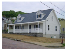
그림 10. 전경

이 프로젝트는 노약자의 안전, 건강, 적은 유지비용이라는 3가지의 대 전제를 두고 설계를 하였다. 적은 유지비용에 에너지의 효율을 좋게 하고 노약자의 라이프스타일에 맞춘 디자인을 했다.