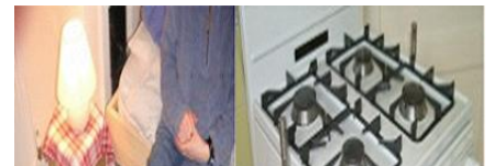
그림 17. Nightlight 그림 15. cooker monitor

영국의 Gloucester 프로젝트의 경우 건축적인 시범사업이라기보다는 치매노인을 위한 IT장비위주의 연구라 볼 수 있으나 장애인 및 노약자를 위한 통합적 개념에서 IT기술은 무장애 건축공간과 더불어 장애인과 노약자의 자립생활을 도울 수 있는 좋은 도구로 활용될 수 있을 것으로 판단됨으로 이런 장애요소별 IT기술은 많은 연구와 개발이 이루어져야 할 것이다. 노약자나 치매환자를 대상으로 자립적인 주거생활을 영위할 수 있도록 IT기술개발을 통해 노인의 주거생활의 만족도를 높일 수 있을 것으로 보인다. 그러나 IT기술 중심으로 프로젝트가 한정되고 있어 물리적인 환경의 개선과 더불어 연구가 통합적 개념으로 진행되는 것이 바람직하다고 판단된다.