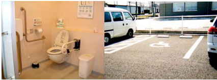
그림 6. 쇼룸의 화장실