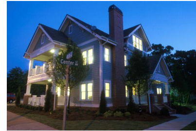
그림 18. 주택전경

Aware Home 프로젝트의 경우 현재 개발된 IT시스템을 주택에 적용함에 있어 실제 거주자 중심으로 설계를 하였고, 이런 연구의 성과를 검증하는 주거 모델이다. 고령의 독거노인과 아이들을 위한 IT장비의 주택에서의 적용성과 전체 시스템 측면으로는 좋은 사례라 할 수 있지만 무장애 건축 공간 및 지역적 측면에서 연계성이 부족해 보인다. 그러나 장애인 및 노약자를 고려한 통합적 모델을 고려할 때 IT기술 요소와 건축공간의 시스템적 연계성 측면에서는 도입 가능한 선행 연구로서의 가치가 있는 것으로 판단된다.