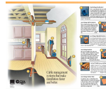
그림 12. 설비 시스템

또한 IT시스템의 적극적인 활용으로 주택내부를 전체적으로 조정하고 감시한다. 에너지 관리는 원격으로 조절되는 온도장치, 전등, 난방기 등으로 하고 있으며 비디오 모니터링과 화재경보를 통해 안전과 보안을 강화하였다. 또한 'Cyber nurse'를 통해 매일매일 인터넷으로 거주자의 건강을 관리한다. 이 프로젝트는 건축 공간, IT시스템의 활용뿐만 아니라 지역 전체를 자립생활이 가능한 시범지역으로 조성하기 위한 연구를 지속적으로 하고 있으며, 대학과 연계하여 학생들의 교육 및 인식개선을 위한 사업도 실시하고 있다.