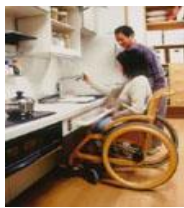
그림 8. 체험관 내부 생애주택체험