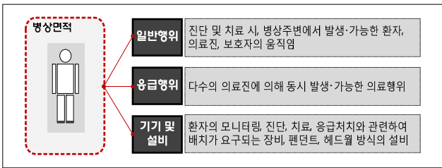
[Figure 2] Major Considerations for the Patient Bed

또한 펜던트, 헤드월 등의 의료설비의 운영을 지원·가능한 규모로 계획되어야 한다. 특히 헤드월 방식 설비의 경우, 벽과 병상 머리면의 인접이 가능하나 펜던트 방식은 설치위치, 운영, 점검 등의 이유로 벽과 병상 머리면의 이격이 요구되므로 병상 당 면적 산정 시 관련사항에 대한 고려가 요구된다.