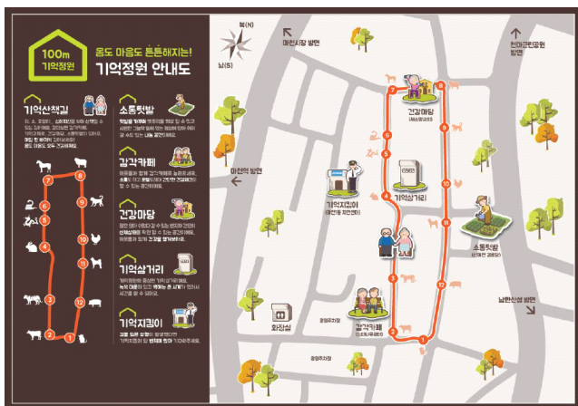
[Figure 2] Guide Map for Renovated Area

노령인구의 입장에서 기존의 마천동 주거환경의 주요한 문제점은 1)비슷한 건물에 좁은 골목길이 대부분인 저층 주거단지이기에 길 찾기에 어려움이 있을 수 있으며, 2)노후화되고 삭막한 주거환경이기에 정서적으로 좋지 않으며, 3)노령인구에게 어둡고 위험한 보행환경이며, 4)이웃들을 만나거나 모일 수 있는 장소가 거의 없으며, 5)신체 활동을 위한 시설이나 공간이 부족하다는 것이다.