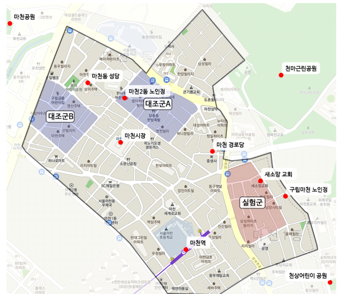
[Figure 1] 실험군/대조군 위치 및 지역 내 주요거점

본 연구는 실험군과 대조군 지역 노령인구를 대상으로 리모델링 사업 사전/사후에 각각 설문조사를 진행하고, 이를 바탕으로 리모델링 사업의 효과성을 평가하였다. 리모델링 사업을 진행하기 이전인 2017년 9월 사전조사를 진행하였으며, 2018년 리모델링 사업을 진행한 후인 2019년 5월 사후조사를 진행하였다. 실험군과 대조군을 직접 방문하여 대상 지역 내 거주민들을 대상으로 설문을 진행하였으며, 응답자와 연구원 면대면으로 조사를 진행하였다.