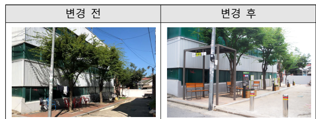
[Table 3] Pre-Post Appearance of Sensory Cafe

마을주민들이 많이 모이지만, 열악한 환경이었던 공영주차장 옆 공간을 심터로 조성하였다. 휴식을 위한 벤치와 파고라, 인지감각 운동기구, 지압길, 자연소리박스 등을 설치하였으며, 보행자의 안전을 위해 볼라드를 설치하였으며, 마을의 휴식공간을 제공함과 동시에 감각을 자극하는 운동공간을 조성하였다.