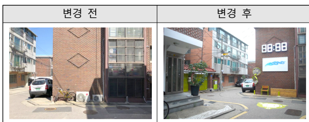
[Table 7] Pre-Post Appearance of 100m 3-way Intersection

좁은 골목길 내 삼거리에 위치를 인지 할 수 있는 거점을 조성하였다. 벤치와 시계, 미술품 등을 설치하였으며, 인접한 주택의 대문을 색칠하여 새로운 인지거점으로 작용 할 수 있도록 하였다.