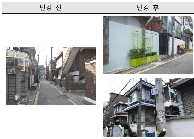
[Table 6] Pre-Post Appearance of 100m Walkway

주거지를 순환하는 영역을 설정하여 적합한 골목 환경에서 계절을 인지 할 수 있는 화단을 설치하였으며, 야간의 보행환경 개선과 골목 미관 개선을 위해 인지조명을 설치하였다.