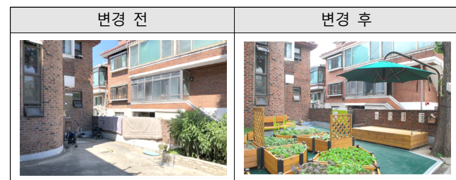
[Table 4] Pre-Post Appearance of Vegetable Garden

기존에 관리가 되지 않던 경로당 마당공간에 텃밭을 조성하였다. 개인/공용 텃밭, 평상, 그늘막 등을 설치하였으며, 텃밭을 직접 관리함으로써 노령자들의 신체적 활동과 정신적 안정에 도움이 될 것을 기대하였다.