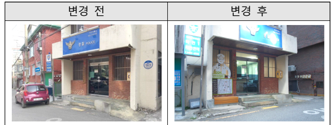
[Table 8] Pre-Post Appearance of 100m Police Box

길 잃은 노령자들이 주로 방문하게 되는 장소인 마천 1동 치안센터에 대기 공간 겸 휴식을 취할 수 있는 벤치를 설치하고, 마을 안내지도를 부착하였다.