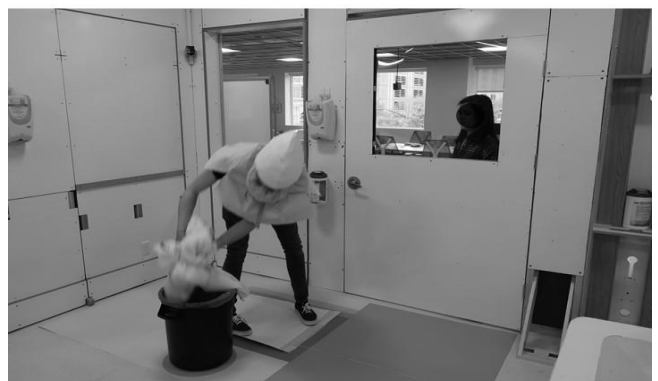
[그림 1] 핵심 설계전략이 적용된 새로운 BCU 탈의공간 디자인과 의료종사자의 PPE 탈의과정 시뮬레이션 과정