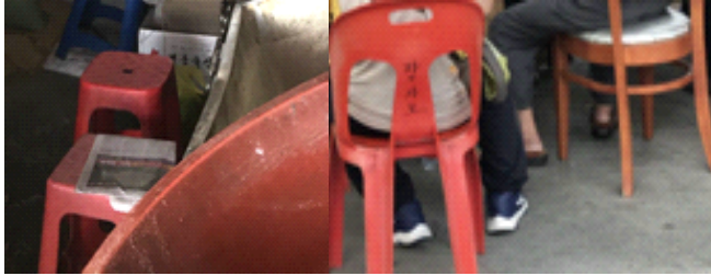
[그림 3] A, C 장소의 의자