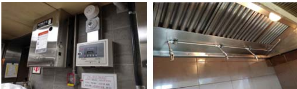
[그림 1] K급화재 가스 소화설비

따라서 조리대 위에는 K급화재(식용유화재)에 대한 적응성을 갖춘 가스 소화설비를 설치하고, 조리대와 연결된 덕트 내에는 정온식 감지기, Fire Damper(방화 댐퍼) 및 가스 소화설비를 설치하여야 한다. 그리고 정상적으로 작동이 가능하도록 1년 단위로 점검 및 덕트 내부를 청소하는 등의 유지관리가 필요하다.