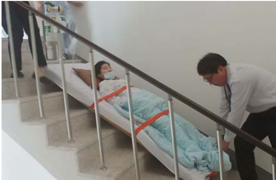
[그림 1] 환자를 매트리스에 고정하고 계단을 내려오는 소방훈련

만 화재 시에 실제로 가능할 지는 미지수다. 어렵게 계단을 내려온다 하더라도 중증도가 높기 때문에 외부 자극으로 인한 2차 피해가 올 가능성이 높다.