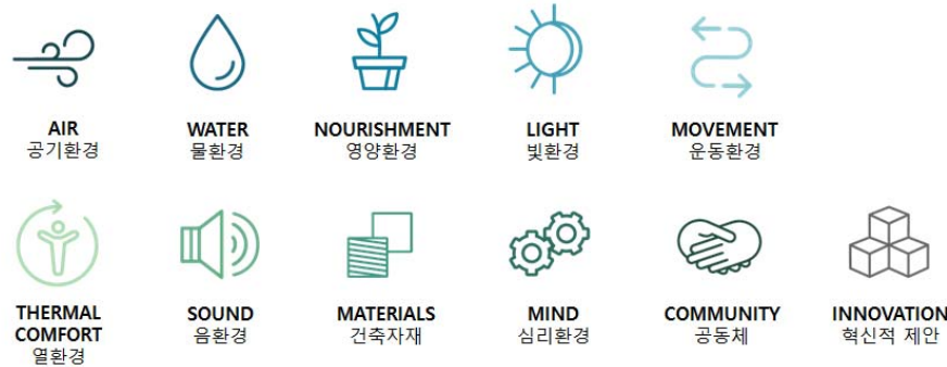
[그림 2] WELL인증의 심사분야 (IWBI; International WELL Building Institute)

대기 미세먼지에 대한 실내공기질 관리의 대안 도출을 위해 외국의 녹색건축인증제도의 내용을 살펴보고자 한다. 녹색건축인증제도는 많은 나라에서 자국의 실정에 맞는 인증시스템을 개발하여 운영하고 있으며 본고에서는 미국의 LEED와 영국의 BREEAM을 선정하여 우리나라의 G-SEED와 비교해 보기로 한다. 또한 녹색건축인증제도는 아니지만 재실자의 건강에 초점을 맞춘 건강건축 인증 제도인 WELL 인증제도(WELL Building Standard)도 함께 검토하였다. WELL은 미국에서 개발되어 2013년부터 시행되고 있는 새로운 개념의 건축인증제도로 인간의 건강과 복지에 중점을 두고 건강 친화적인 건축물의 설계, 시공, 운영에 대해 평가하는 제도이다. [그림 2]는 WELL의 10가지 심사분야 (10 Concepts)를 나타낸 것이다.