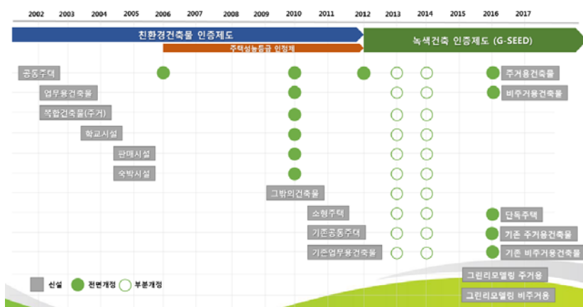
[그림 1] 녹색건축인증 연혁 (건설기술연구원)