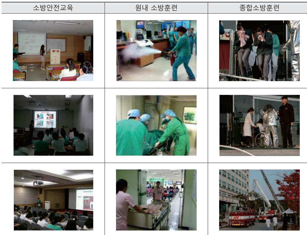
[표 5] 소방안전관리 시스템