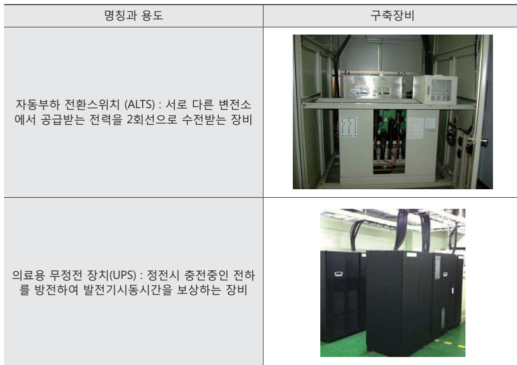
[표 6] 전력안전장비

표 6은 전력의 중단 없는 공급을 유지하기 위하여 2곳의 변전소로부터 공급받는 전력을 통제하고 전환하는 장비와 정전사태 발생시 비상발전기를 가동하기 직전에 작동되는 의료용 무정전 장치를 보여주고 있으며, 이러한 장비는 상시적으로 점검되는 시설관리의 요소가 된다.