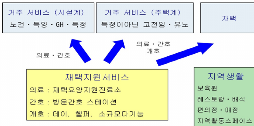
다양한 서비스를 복합시킨 거점 정비