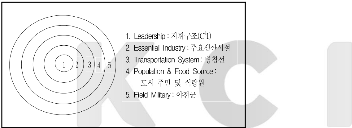
<도표 3> 현대전 / 미래전 수행을 위한 국가체계별 타격목표