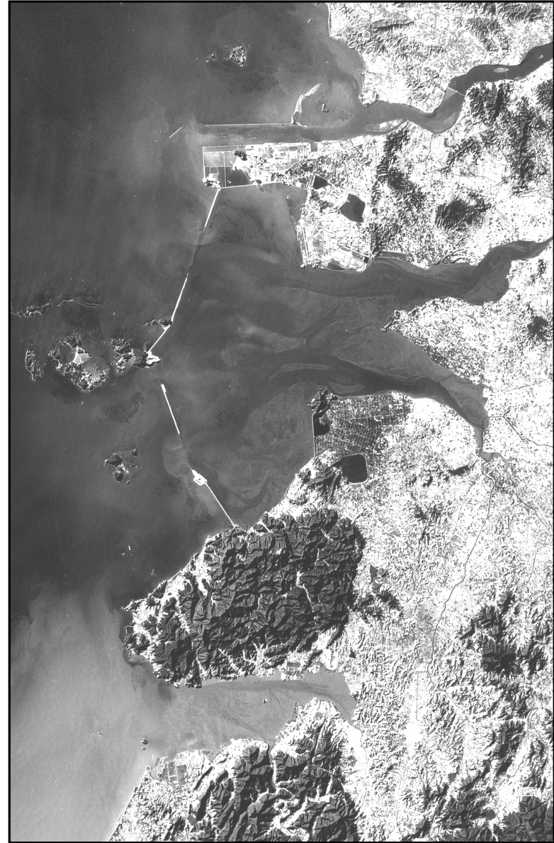
<그림 3> 금강과 변산반도 부근의 서해안지역