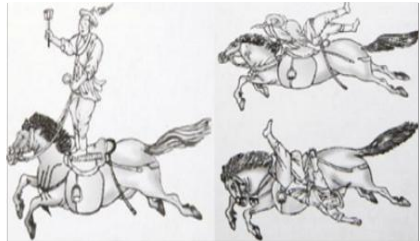
[그림 1] 『무예도보통지』에 나타난 마상재

이성계가 적장의 창술과 화살을 피하는 모습은 마상재의 동작들과 흡사한 모습을 띤다. 『무예도보통지』는 1789년(정조13) 가을에 정조의 명으로 편찬을 시작하여 1790년에 완성된 병서로 이전 병서인 『무예제보』나 『무예신보』에 비해 마상무예가 추가된 것이 특징이다. 24) 마상무예가 추가된