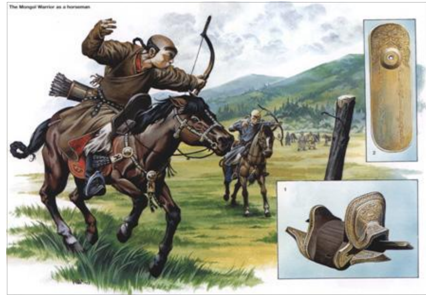
[그림 2] 유목민의 기사술 훈련(Qabaq)

마상 활솜씨와 기동성을 최대로 이용하여 적의 화력범위 밖에서 머무르며 치고 빠지는 전법과 적을 포위하여 외부에서 돌면서 적을 괴멸시키는 전법을 구사하기 위해 궁수의 사거리 내에서 전투를 시작하였다.