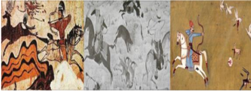
[그림 3] 파르티안 샷과 유목적 전통

훈련되었기 때문이다. Nerge와 Qabaq 41) 이라는 사냥훈련 외에도 ‘파르티안 샷(Parthian shot)’이라 불리는 기사술을 통해 유목민의 보편적인 군사양식을 확인할 수 있다. 42)