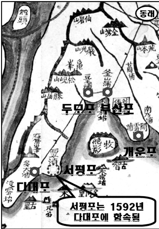
그림 3. 다대포와 서평포 위치

다대포 역시 부산포와 마찬가지로 일본군의 동향을 탐지하고 있었으며 후망에 의해 신속한 동원이 실시되어 수성전을 실시한 것으로 판단된다. 전투에 대한 구체적인 기록이 없지만 부산포 일대에서 일본군의 접근에 대한 조선군 전파체계가 원활하게 작동되고 있었음을 고려해야 한다. 31) 응봉