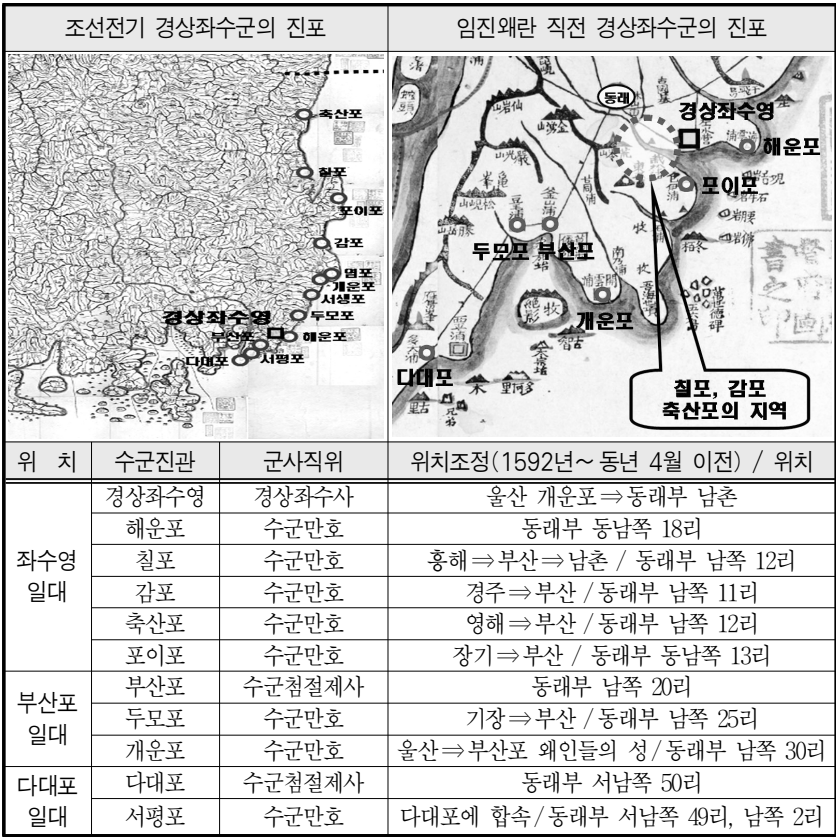
그림 1. 1592년 경상좌수군 진포(鎭浦)의 위치

나 이러한 논의는 모든 수군작전을 포기하고, 수군을 육군으로 전환하는 것이 아니었다. 15) 조정의 논의 내용을 보면 수군을 육군으로 전환하고자