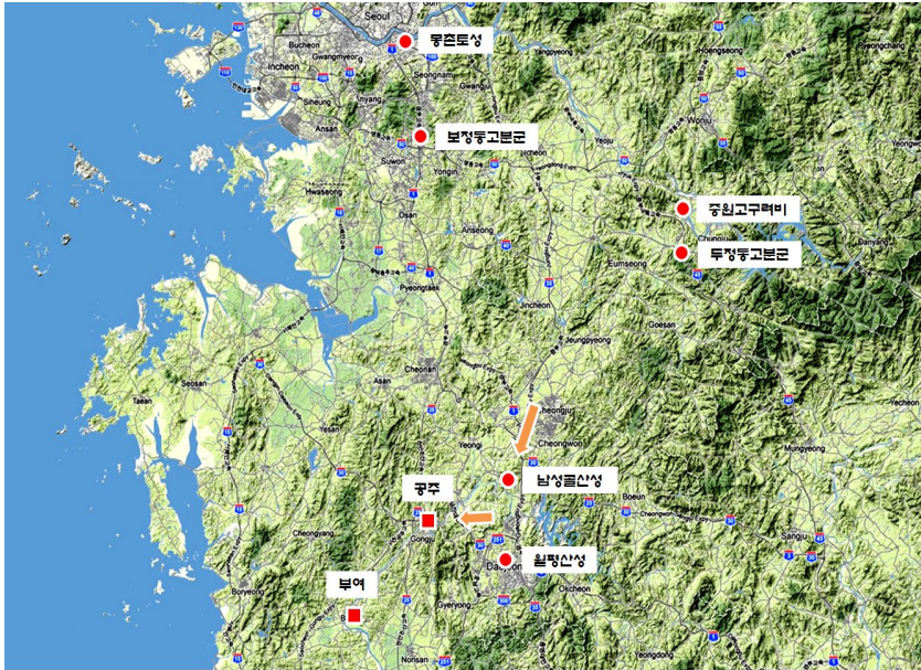
〈그림 1〉 한강 이남지역의 고구려 유적 분포

셋째, 475년 이후 축조된 고구려 유적 가운데 가장 남쪽에서 발굴된 자료가 대전 서구 월평동산성과 청원 부용면 남성골산성이다. 〈그림 1〉 먼저, 월평동산성은 두 차례에 걸쳐 발굴되었다. 국립공주박물관과 충남대학교박물관이 공동으로 발굴 조사한 월평동유적에서는 정수장 부지 내에서 산성 축조 이전의 원지표층 아래에서 溝狀遺構, 柱孔, 圓形 竪穴遺構 등이 확인되었다. 이들 유구에서는 심발형토기, 장란형토기, 외반구연호, 고배 등 백제 웅진기 유물이 출토되었다. 그 이후시기에 축조된 저장공, 수혈 등의 유구에서 고구려 토기가 여러 점 출토되었다. 14) 충청문화재연구원이 학술발굴조사를 실시한 월평산성에서는 고대지 남쪽 능선지역 수혈유구와 지표에서 용, 장동호, 동이, 시루, 완, 접시