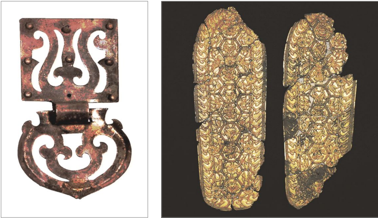
〈그림 3〉 5세기 후반 신라와 백제의 문물교류 사례(좌: 공주 송산리 舊1호분 과판 - 신라산-, 우: 경주 식리총 식리 - 백제산-)

즉, 공주 송산리 고분군에서 신라산 은제 허리띠 장식이 출토되었고 101) 신라 왕릉급 무덤에서 백제산 금동 식리와 청동용기류가 출토된 바 있다. 102) 혼인동맹으로 양국 간의 우호관계는 더욱 굳건해졌다. 언제든 동맹국에서 적국이 될 수 있는 상황에서, 5세기 초반에 맺어진 동맹 관계가 5세기 후반까지 이어진 것은 고구려의 남진을 저지해야만 하는 두 나라의 이해관계가 일치되었기 때문이다. 그리고 이 시기 고구려의 백제 공격이 1회에 그친 것은 고구려의 공격 대상이 백제가 아닌 신라라는 점을 잘 보여준다.