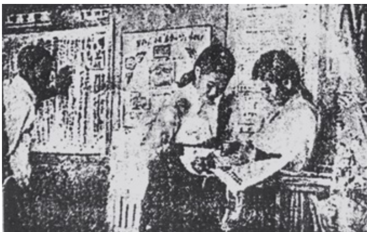
출처: “ 룡강군 서부리 민주선전실,” 『로동신문』, 1951년 8월 12일.

대내외 장식면에서 또 다른 중요한 변화는 민주선전실장이 조소문화협회 리위원장직을 겸직하면서 민주선전실 내 조소친선실이 설치 및 운영 75) 되었다는 사실이다. 조소반에서는 소련의 전쟁 승리 경험을 집중적으로 교육시켰다. 소련인민들의 영웅적인 투쟁, 특히 쿨호즈 농민들이 고난을 극복하며 전쟁 승리에 이바지한 경험을 집중 교육시키며 전쟁의 승리와 이를 위한 교육과 동원정책에 대한 정당