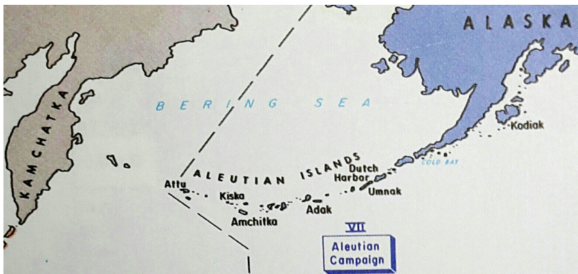
(지도 2) 알류산 열도와 소련군 훈련 후보지역(더치 하버, 콜드 베이, 코디악)의 위치

1945년 1월 초 소련 해군 총사령관 쿠즈니초프(Н. Г. Кузнецов)는 자국 병사들이 훈련받을 장소로 미국 알래스카의 알류산 열도의 섬 중 소련에 근접하여 친숙한 더치 하버(Dutch Harbor)를 제안하였다.