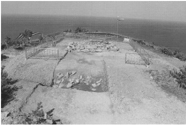
사진 1. 강릉(동해) 어달산 봉수대 연대와 환호 * 출처 : 강릉대 박물관, 2001