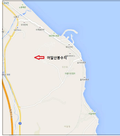
그림 2. 어달산봉수의 위치