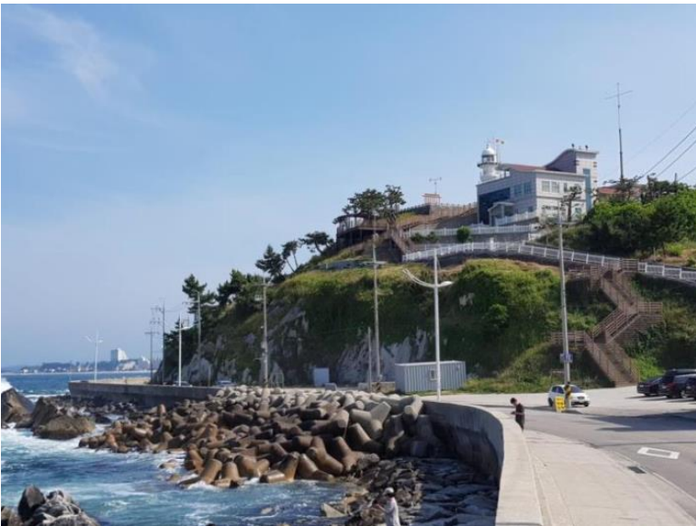
사진 10. 강릉 주문산봉수 원경(북→남)