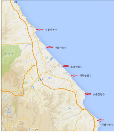
그림 1. 조선시대 강릉지역 연변봉수 위치 분포도