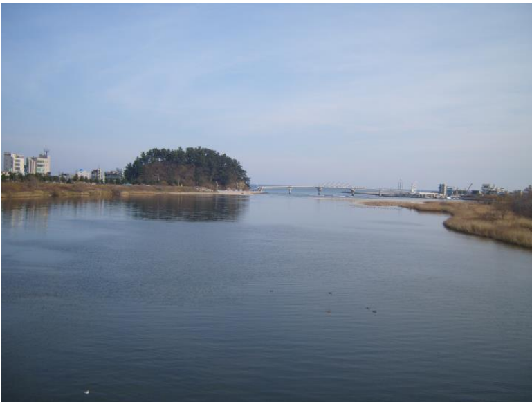
사진 6. 강릉 소동산봉수 원경1(서→동: 남대천 하구)