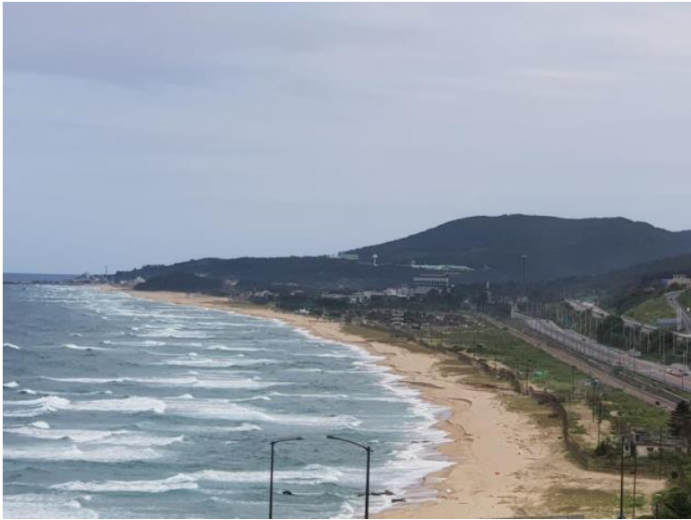
사진 3. 강릉(동해) 어달산봉수 원경(북→남)