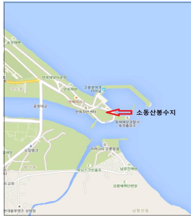
그림 4. 소동산봉수의 위치