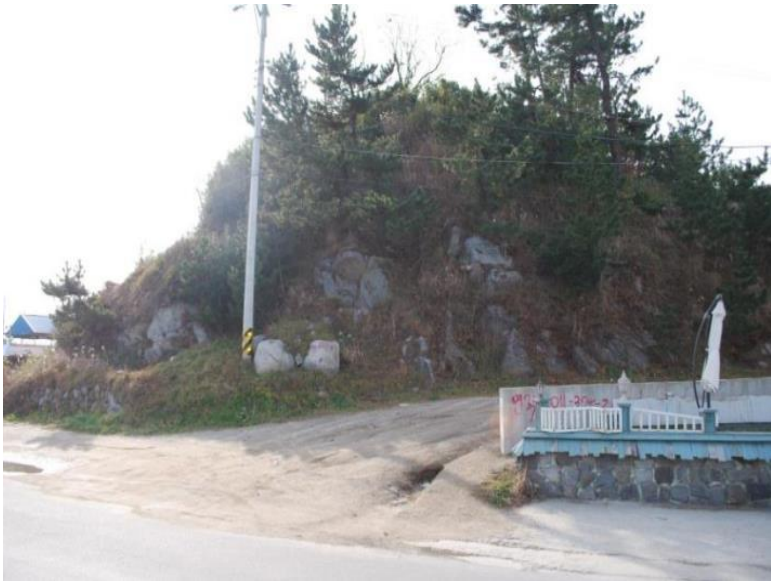
사진 8. 강릉 사화산봉수 원경(북→남)