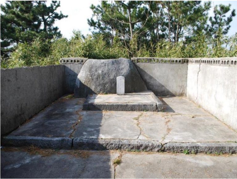
사진 9. 강릉 사화산봉수 진경(동→서)