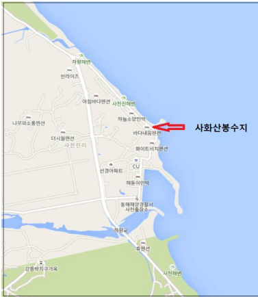
그림 5. 사화산봉수의 위치