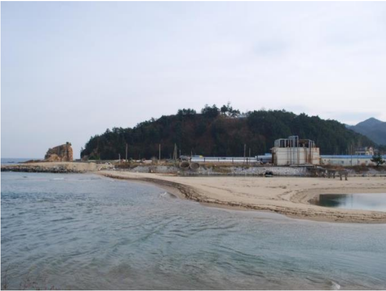
사진 5. 강릉 해령산봉수 원경(북→남)