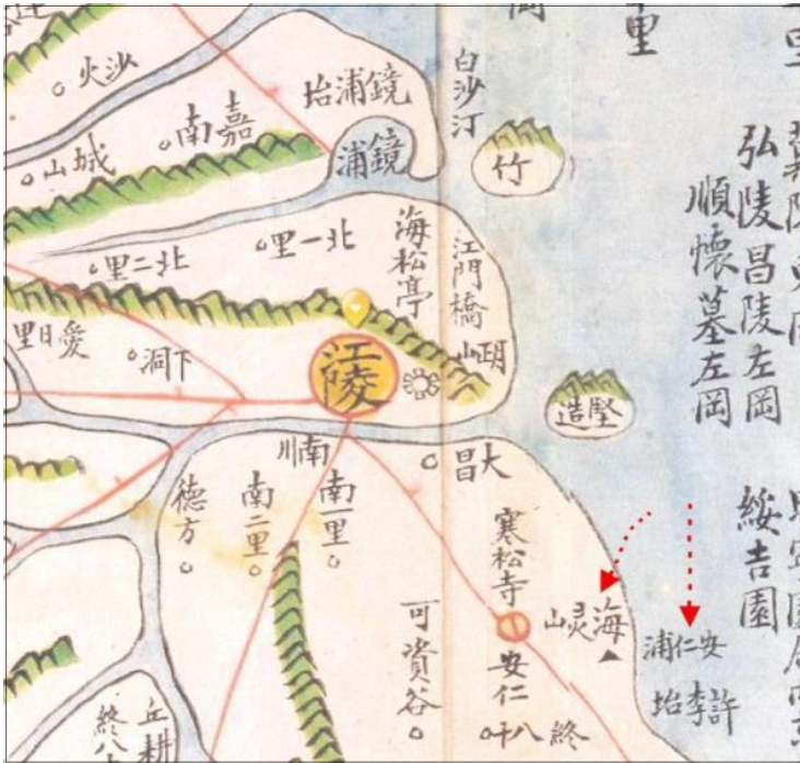
그림 7. 동여도의 해령산(봉수)과 안인포