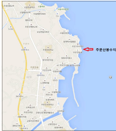
그림 6. 주문산봉수의 위치