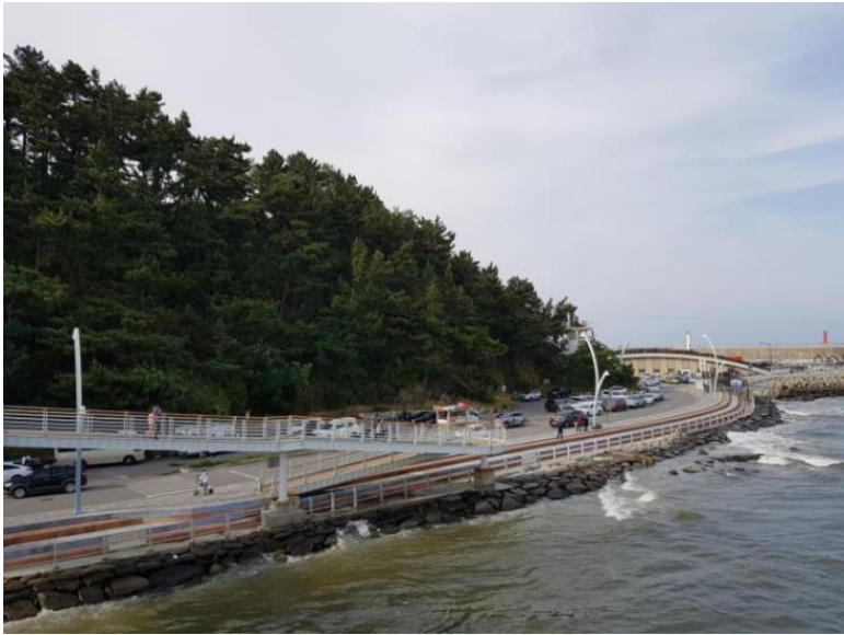
사진 7. 강릉 소동산봉수 원경2(서남→북동)