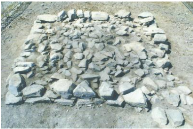
사진 2. 강릉(동해) 어달산 봉수대 방형기단