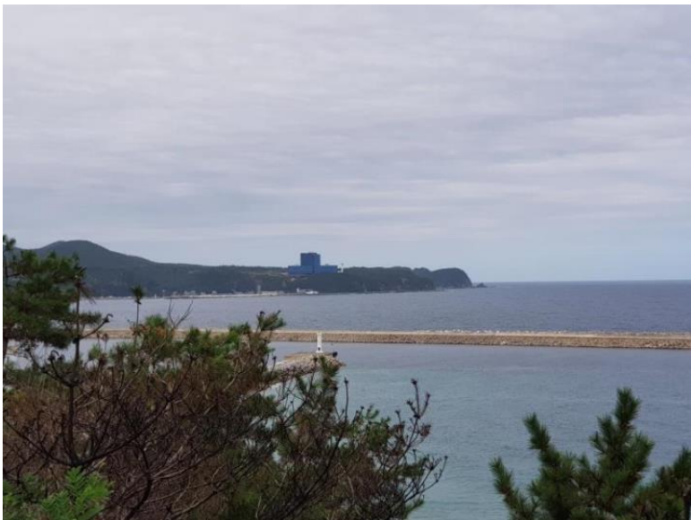
사진 4. 강릉 오근산봉수 원경(남→북)