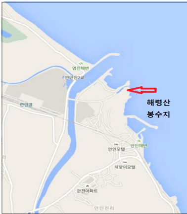
그림 3. 해령산봉수의 위치