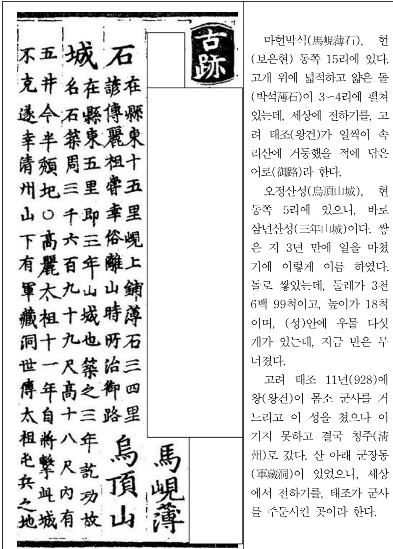
<그림 2> 『신증동국여지승람』 권16, 충청도, 보은현, 고적