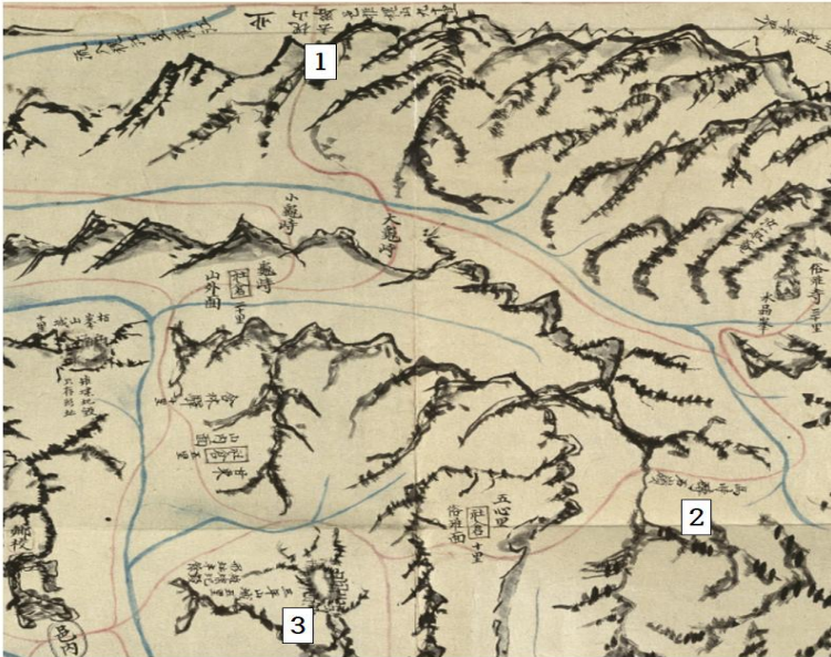
<그림 3> 고려군 진군로 : ① 괴산으로 가는 길(괴산거로槐山去路) → ② 마치박석령(馬峙薄石嶺) → ③ 삼년산성 59)