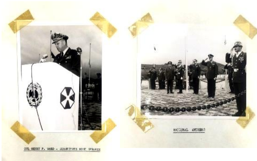
<그림 5> 애국가 연주 한, 미 81)

이제까지 살펴본 유엔묘지에서 '재한 유엔기념묘지'로의 변천 경위를 정리하면 <표 1>과 같다.