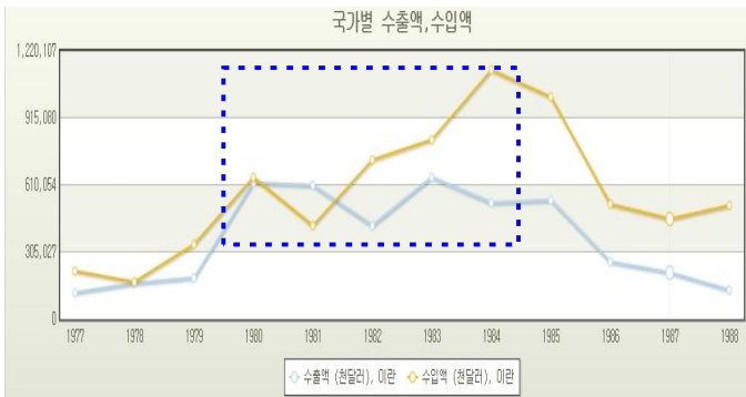
<표 2> 한국-이란 교역 현황(1977-1988)

반면, 전쟁 기간 중 이란의 대(對)한국 접근은 다소 상이한 모습을 드러낸다. 군사적인 접근보다는 경제적인 교역에 집중하는 모습이였다. 대한민국은 1970년대 중동 진출 과정에서 2만여 명 이상의 한국인이 이란 내 건설시장 등에 진출하여 양국관계 발전의 기반을 닦고 경제성장에 크게 기여하였다. 그리고 1970년 후반과 1980년 초 반미성향의 호메이니 정권 등장, 테헤란 미 대사관 인질 사건 등으로 미국과 이란의 관계가 경색되면서 일시적으로 한국-이란 관계가 소원했던 시기가 있었지만, 이는 곧 회복되었다. 이란은 전쟁수행과 경제적 목적을 위해 다른 나라의 지원을 필요로 하였고 한국과의 관계개선에 나섰던 것이었다. 한국과 이란의 경제적 교류는 한국 기업들의 중동 진출과 건설 프로젝트에 집중되었다. 실제로 1981-1984년의 전쟁 초기 기간 한국과 이란의 교역량은 2.5배가량 증가한 것을 볼 수 있다.