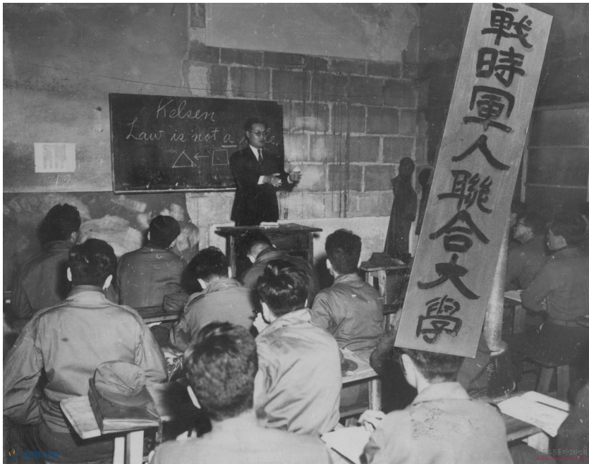
<사진 1> 전시군인연합대학 수업 광경

특강〉과 〈한국제도사〉가 과목선택으로 들어 있는 특징이 있다. 이는 전시군인연합대학이 수강생들에게 기대하는 바가 있음을 알 수 있다. 즉 그들을 심리전이나 정훈 교육의 첨병으로 활용하고자 하는 것이다. 후술에서도 밝혀지듯이 이들이 학기를 마치고 다음 학기를 준비할 때까지는 자대로 복귀하여 정훈관의 임무를 맡았다는 것을 통해서 알 수 있듯이 과목에서도 이러한 취지를 엿볼 수 있다.