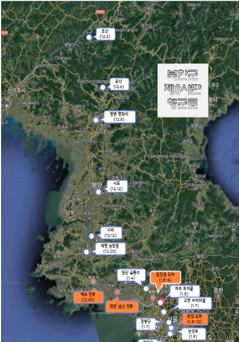
〈그림〉 북한군 제8사단 행군로