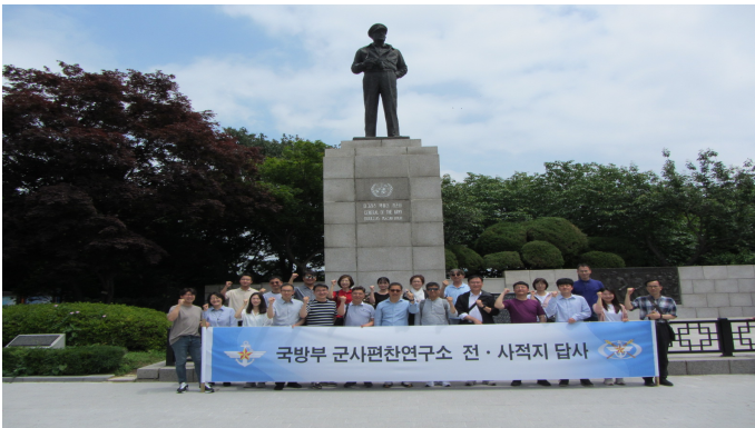
〈2023년 국방부 군사편찬연구소 전반기 전·사적지 답사〉