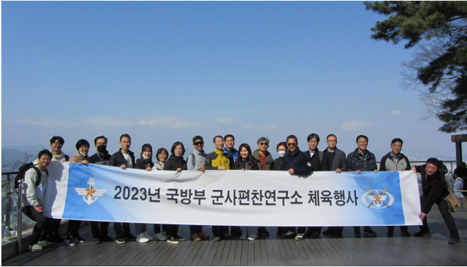
〈2023년 국방부 군사편찬연구소 체육행사〉