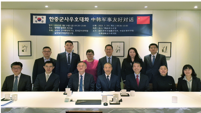
<『한미동맹 70년사』 발간을 위한 한중 공동세미나>