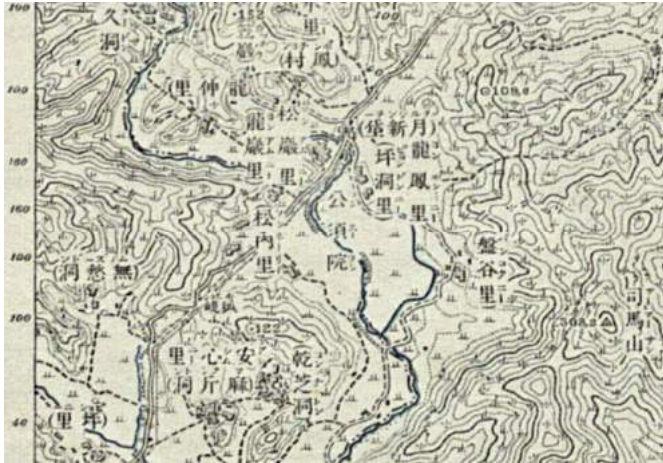
〈그림 3〉 「朝鮮五萬分一地形圖: 公州」(1922) 중 公須院(*정중앙)