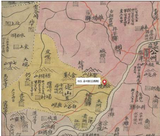
〈그림 2〉 「靑邱圖」 중 칠갑산-정산-공서원-공주 성두면 동천-웅진-공주감영 경로

충청감영에서 공수원까지는 13km로 강을 1번 도하하고 도보 3시간 30분 거리다. 공수원은 공주 우성면의 경계 지역인 정산군 목면 송암리(지금의 청양군 목면 송암리)로, 철마산(지금의 미결산) 동남쪽 무죽바위산(해발 160m) 동쪽 끝자락에 위치하며 매복하거나 관측하기에 최적 장소였다.