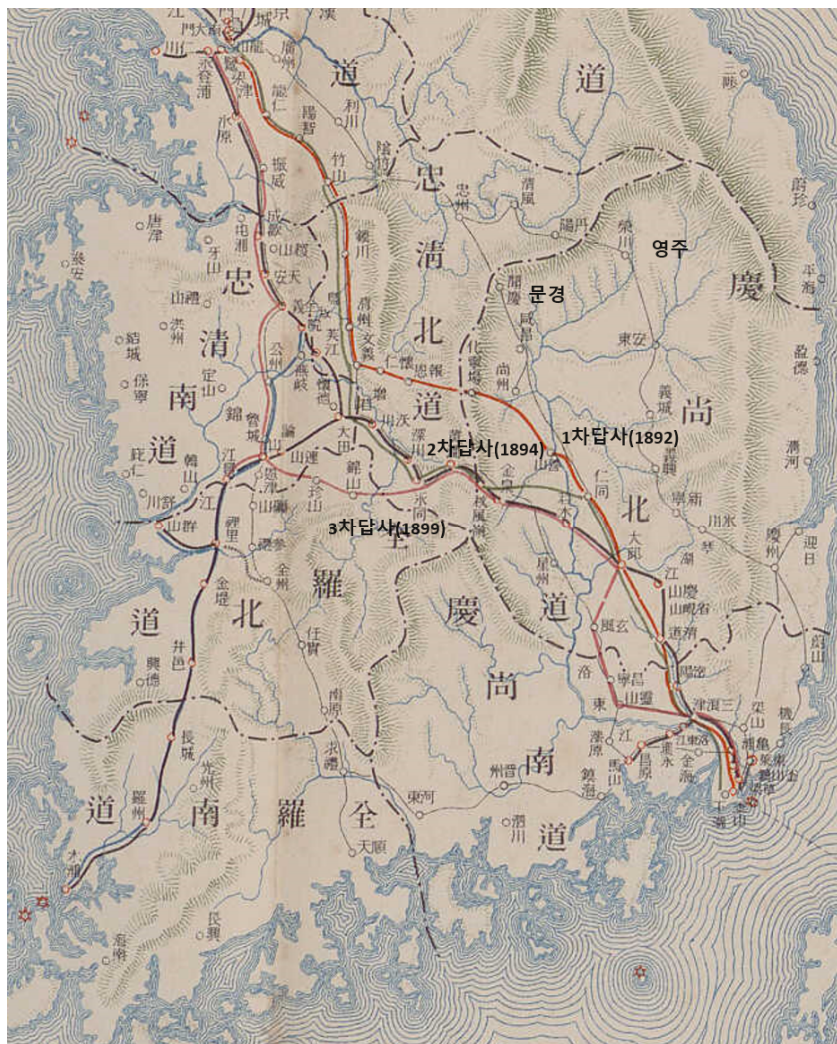
〈그림 1〉 : 1915년 조선철도사 수록 경부철도 답사 노선도