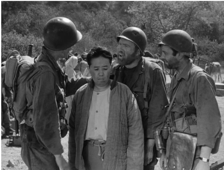
출처 : <철모>