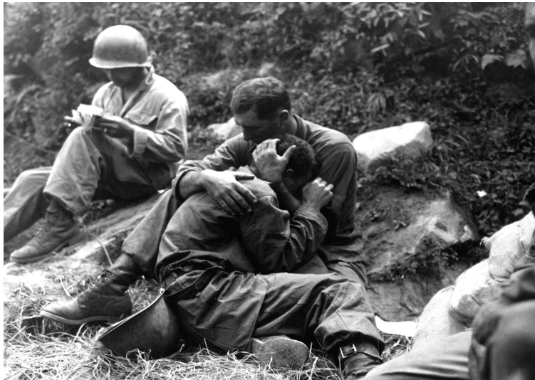
출처 : U.S. Army Korea Historical Image Archive. Korean War-HD-SN-99-03118

그 무엇보다도 한국전쟁의 미국군인을 희생자로 만든 것은 육체적 부상보다는 정신적 부상이었다 <그림 3>. 한국전쟁 초반 무기력과 같은 정신장애를 호소하는 정신적 사상자 (psychiatric casualties) 수가 1000명중 250명에 달했다. 이 높은 비율은 그들이 받은 고통의 정도를 가늠케 한다. 19) 그들에