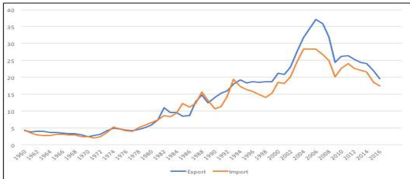
<그림1> GDP 대비 중국의 대외무역 비중 변화 1960-2016

자료: WTO, World Development Indicator(2017) 참조.