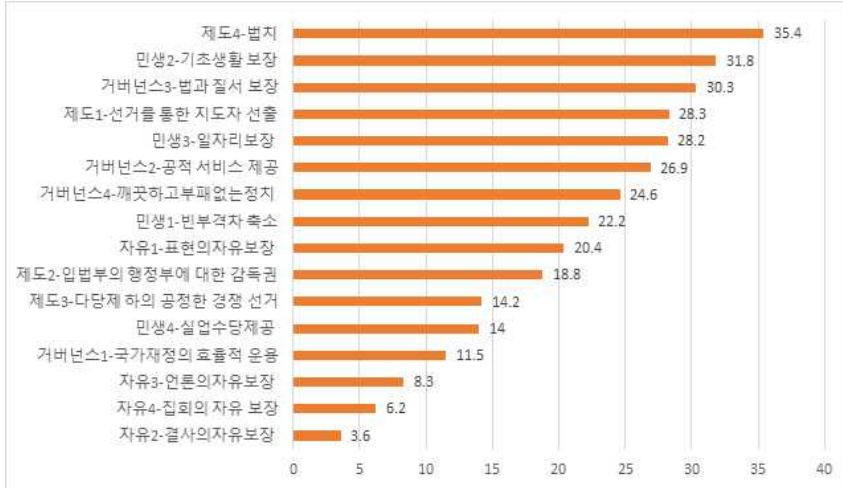
<그림2> 중국인들의 민주주의에 대한 이해