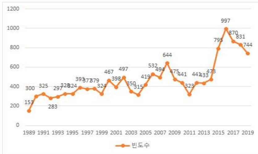
[그림 1] 아사히신문 이민관련 기사 수(1989-2019)

정책적 측면에서 일본 내 이민논쟁은 1999년 사카이야 다이이치(堺屋太一) 경제기획청장관이 경제심의회 글로벌리제이션 부회에서 “다양하고 열린사회의 변화와 장래 예상되는 저출산 고령화 대책의 관점에서 이민국가가 되지 않으면 안된다고” 발언한 이후 본격화되었다. 9) 또한, 2000년 오부치게이조(小淵