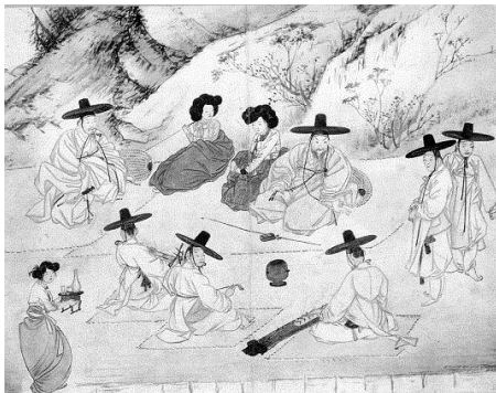
<그림 2> 삼춘야흥 (봄날의 들판에서 여흥을 즐기다)

또한 《혜원전신첩》이 표출하는 욕망과 이에 직결된 오감 이미지의 경우, 시각은 색채의 표현기법을 대비, 강조, 비교로 구분하여 살펴보았다. 그 결과, 적색·청색의 보색대비가 가장 많았으며<그림 5> 다음은 녹색, 백색 등의 단색 또는 적·녹·황색의 삼원색으로 강조하는 경우였다. 아울러 같은 청색의 농담(濃淡)으로 비교하는 경우도 있었다.<그림 6> 청각의 경우에는 악기소리가 가장 많았고(8건) 다음은 심리 또는 상황으로 유발된 정적(7건)으로 청각적 요소와 대립을 야기하였다.<그림 7> 이 밖에 대화, 자연의 소리(계곡물 소리 등)가 각 5건, 남녀의 애정관련 소리가 4건이었다. 후각은 담배연기가 14건 등장하여 약 50%였으며 꽃향기(6건), 음식냄새(4건-술, 주안상 등) 등의 순서였다. 또한 미각은 후각의 경우와 유사하여 담배(14건), 음식 6건-주안상(4건) 등-이었다. 마지막으로 촉각은 대개 손으로 하는 행위, 예컨대 놀이<그림 8>, 애무, 마주잡기, 잡아끌기<그림 9> 등 다양함으로써, 손이 인간의 욕망을 표출하는 일차적 수단임을 확인할 수 있었다.