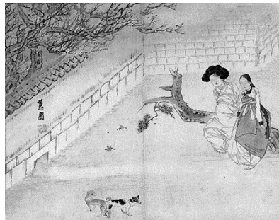
<그림 17> 이부탐춘 (과부가 색을 즐기다)