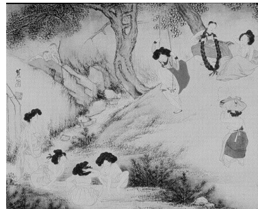
<그림 15> 단오풍정 (단오날의 풍경)