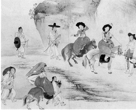
<그림 4> 연소답청 (젊은 선비들이 봄풀을 밟는 놀이를 하다)