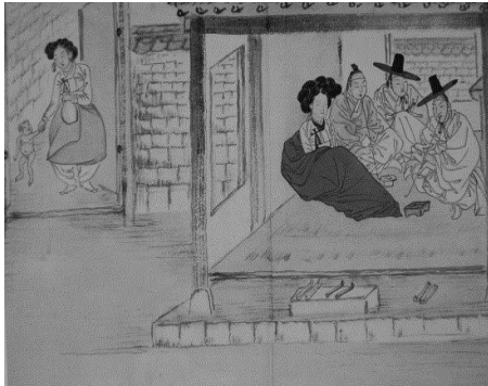
<그림 6> 흥루대주 (술집에서 술을 기다리다)