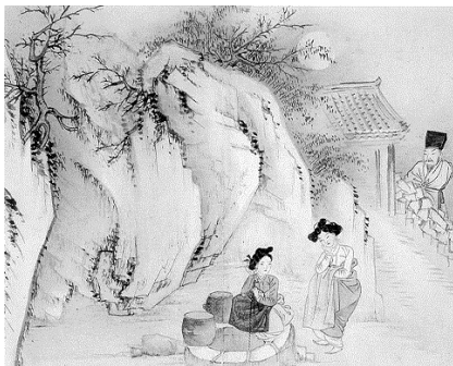
<그림 12> 정변야화 (야심한 밤 우물가에서 나누는 이야기)