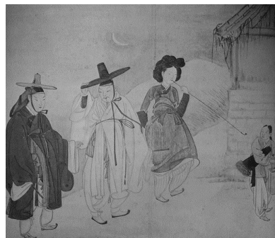
<그림 13> 야금모행 (심야에 금지된 비밀나들이)