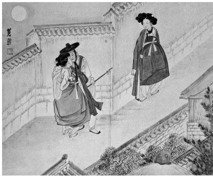
<그림 10> 월야밀회 (달아래서의 은밀한 만남)

가령 《혜원전신첩》중에서 <월야밀회(月夜密會)>(그림 10), <월하정인(月下情人)>(그림 11), <정변야화(井邊夜話)>(그림 12), <야금모행(夜禁冒行)>(그림 13)은 밤에 벌어지는 인간의 춘의를 담고 있다. 밤은 은밀함의 시간이다. 밤의 어둠은 시각을 약화시키지만 다른 감각을 극대화시킨다. 남녀는 서로 근접하며 보다 사적이고 친밀한 관계를 형성하는 감촉(touch)으로 속삭인다. 밤, 골목길, 담이 형성하는 시공간적 배경은 남녀의 일탈된 만남을 예고한다. <그림 10>과 <그림 12>에서 남녀를 몰래 엿보는 촉각적 시선의 긴장감은 우리를 그 현장으로 이끈다.