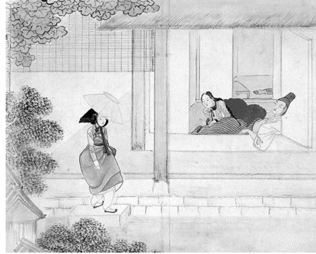
<그림 5> 기방무사 (기방에서는 아무 일도 없었다)