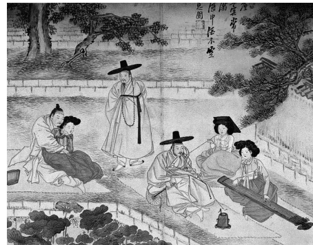
<그림 3> 청금상련 (가야금을 들으며 연꽃을 감상하다)