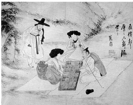
<그림 8> 쌍륙삼매 (쌍륙놀이에 빠지다)