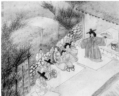
<그림 14> 무녀신무 (무녀가 신내림 춤을 추다)

<무녀신무(巫女神舞)>(그림 14), <단오풍정(端午風情)>(그림 15), <문중심사(聞鐘尋寺)>(그림 16), <이부탐춘(鰲婦耽春)>(그림 17)은 청각으로 야기되는 금기 위반의 촉각적 시선들이라고 할 수 있다. <그림 14>에서 굿판의 떠들썩한 소리는 굿당의 경계 밖에 있는 남자에게 촉각적 시선을 주고받는 관계의 여자를 몰래 만날 수 있는 신호로 작동한다. <그림 15>에서는 단오 풍속을 즐기는 여자들의 흥겨운 소리가 계곡물 소리를 넘어 두 동자승들을 유인하고, 그들은 바위에 몸을 숨겨 여자들만의 유희의 시간을 훑쳐본다. 또한, <그림 16>의 경우 절에서 울리는 종소리가 지체 높은 집안의 과부에게 금지된 바깥출입에 구실을 달아준다. 굳이 절 밖까지 마중 나온 중의 자태는 촉각적 시선을 감추고 있다. <그림 17>의 과부는 흘레 붙은 개 1쌍과 짝짓고 있는 새 1쌍을 바라본다. 그들이 절정에 다다르며 내는 소리는 과부의 시선을 더욱 뜨겁게 만들며 자신에게 금지된 욕망이 세상의 이치이자 인간의 본성임을 환기시켜준다.