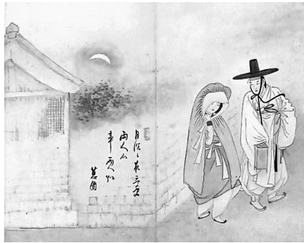
<그림 11> 월하정인 (달 아래의 연인)