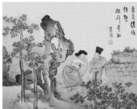
<그림 9> 소년전홍 (젊은이가 붉은 꽃을 자르다)