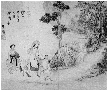
<그림 16> 문중심사 (종소리를 듣고서 절을 찾아가다)