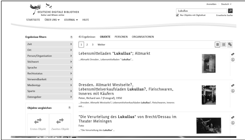
〈그림 1〉 독일전자도서관에서 〈루쿨루스(Lukullus)〉 검색 결과 14)

현재 한국의 국립중앙도서관과 국회전자도서관의 검색과 비교해보면 확연한 차이를 볼 수 있다. 한국의 도서관 검색에서 제시되는 검색 내용은 여전히 텍스트 중심으로 제시된다. 부분적으로 멀티미디어와 연계되더라도 그것은 자료가 있음을 확인하는 정도이다. 그러나 독일전자도서관의 경우 고품질의 이미지 제공을 비롯해서 범미디어 결과들이 제시되면서 바로 편리하게 연계된다. 이로써 방대한 정보들은 단순히 나열되기보다 의미론적 연계를 통해서 맥락적으로 구조화되고, 이를 통해 사용자는 점차 자신이 찾고자 하는 정보와 대화식의 소통을 통해 전자화된 문화유산에 보다 쉽게 접근하게 되며 멀티미디어를 포함하여 언제 어디서나 원하던 정보 서비스를 얻게 되고 링크된 모든 미디어와 바로 연결되는 것이다. 최적화된 멀티미디어 접근은 차세대를 겨냥한 것이기도 하다. 따라서 구조화된 데이터의 활용은 다음의 6단계를 통해 지능화 될 수 있다.