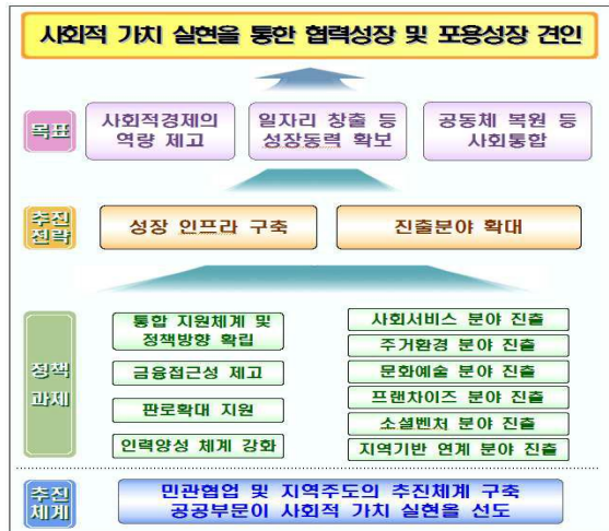
[그림 2] 사회적 경제 조직의 목표와 전략