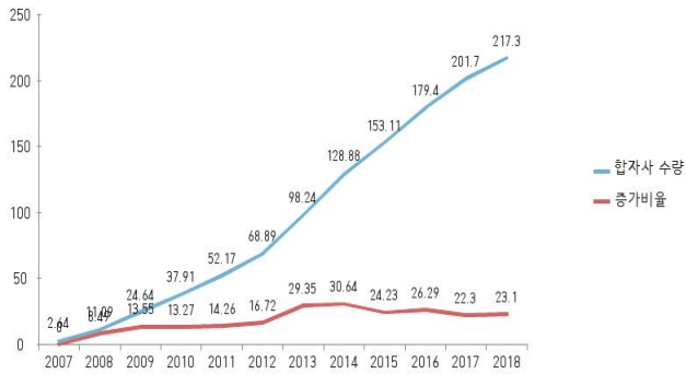
[그림 2] 2007-2018년 중국 농민전업합작사 상황 출처: 중화인민공화국 국가시장감독관리국 자료 재정치