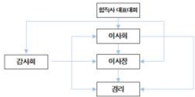
[그림 4] 중국 농민전업합작사 지배구조도