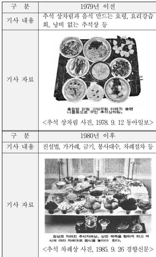
<표 1> 1980년대 전·후 상차림의 변화

1970년대까지 ‘추석 상차림’이었던 기사 내용이 1980년대 이후에는 ‘추석 차례상’으로 변화됨을 보여주고 있는데, 내용과 게재된 사진을 비교하면 ‘상차림’의 관점에