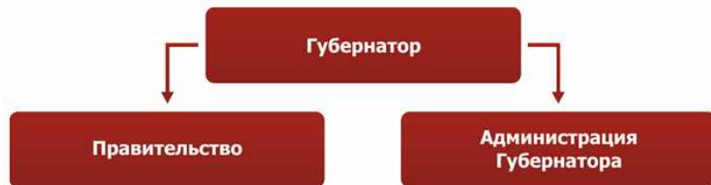
<표5> 끄라스노야르스크 변강주 지사의 권한실현 구도

하카시아 공화국 수장-정부의장은 공화국의 최고공직자로서, 연방대통령이 정하는 대내 정책의 기본방향을 국가기관과 지방자치기관이 실행하는 것에 대한 전반적 지도를 실현한다. 집행기관, 연방집행기관의 지역기관, 지방자치기관, 공공단체 활동의 상호작용과 연합을 조직하고 시민사회의 형성과 발전에 기여한다. 공화국 정부를 구성하고 지휘하며, 그 활동을 지도하고 집행기관의 구조를 정한다. 공화국 경제, 산업, 자연자원의 합리적 이용, 최우선적인 민족적 프로젝트 “러시아 시민에게 알맞는 안락