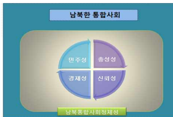
<그림 2> 한반도 사회통합정체성 모형

따라서 한반도 미래세대의 사회통합정체성은 남한의 자유민주주의와 시장경제 제도의 체제 위에 북한의 자발적으로 내면화된 충성성과 신뢰성이 융합되어야 한다. 김일성 유일사상체계 집단정체성의 ‘자발적 성격’은 ‘충성성’과 ‘신뢰성’이다. ‘충성성’과 ‘신뢰성’은 북한의 사회주의체제 성립 과정에서 북한 주민의 동의에 의해서 자발적으로 형성되었으나 경제난 이후 약화되는 것으로 나타나고 있다. 반면 ‘규범적 성격’인 ‘체제우위성’과 ‘체제우월성’은 강제적 성격을 갖고 있기 때문에 경제난 이후에도 체제에 의해서 강제적으로 유지되고 있는 김일성 유일사상체계의 집단정체성 특징이다(이현주 2014). 통일 이후 북한 주민에게 내면화되어 있는 ‘충성성’과 ‘신뢰성’을 한반도 전체를 위한 ‘충성성’과 ‘신뢰성’으로 전환할 수 있을 때 북한 주민의 자발적인 참여에 의한 한반도의 사회통합은 실현될 수 있을 것이라 볼 수 있다. 한반도 사회통합정체성 모형은 <그림 2>와 같다.