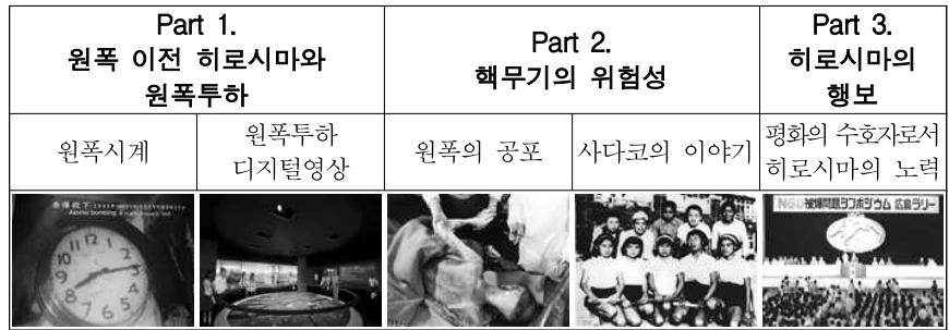
<표 2> 히로시마평화기념자료관의 전시구성과 주요 내용

평화공원 인근에 2016년 9월 조성된 오리즈루타워는 전혀 새로운 이미지로서의 히로시마를 보여준다. 오리즈루타워는 히로시마의 지역기업으로 자동차 등으로 잘 알려져 있는 마쓰다(MAZDA)사에서 조성한 공간으로, 문화공간과 오피스 공간으로 구성되어 있다. 일반 관람객들이 방문할 수 있는 공간은 상품판매 공간인 물산관(1F)과 타워 상층부의 전망대 및 카페, 유료 체험공간(12F, RF) 등이 있으며, 종이학을 테마로 구성되어 있는 복합문화공간을 지향한다.