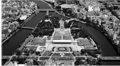
▪ 히로시마시 홈페이지 3)