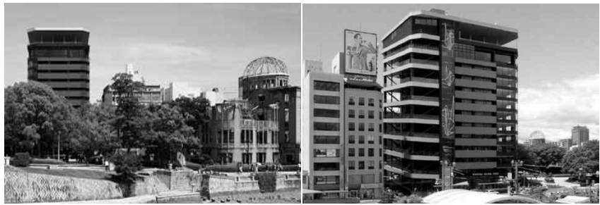
<그림 5> 오리즈루타워 건물 전경