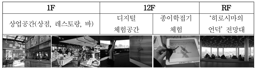
<표 3> 오리즈루타워의 공간 구성

와 사다코를 떠올리게 된다. 사방으로 뚫린 전망대의 유리벽 너머로 파노라마처럼 펼쳐지는 평화기념공원의 모습과 재건된 도시로서의 히로시마의 모습은 그들이 전달하려는 메시지를 도시의 경관을 통해 보여준다. 평화로운 히로시마에 드리운 원폭이라는 절대적 공포와 그림에도 불구하고 이를 자각하며 평화도시로서 성장하고 있는 히로시마의 모습을 직접 확인하도록 유인한다. 평화기념자료관이 히로시마가 왜 평화도시가 될 수밖에 없었는지에 대해 나름의 논리를 통해 상세하게 설명하는 방식을 취하고 있다면, 오리즈루타워는 공간의 체험과 사색을 통해 방문객이 직접 평화도시 히로시마를 발견할 수 있도록 구성하고 있다.