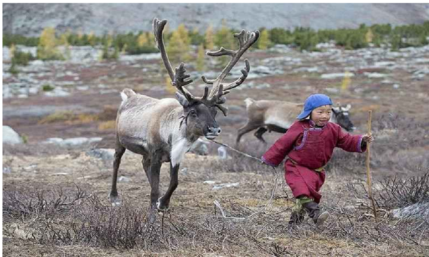
<그림 2> 추코트카 자치구에서 순록 사육 모습 23)

순록 고기 가공은 (주)추코트오프토르그와 ‘폴라르니’ 두 개의 기업에 의해 이루어진다. 2010년부터 (주)추코트포르드토르그는 ‘올레니나 투쇼나야’ 브랜드로 순록 고기로 만든 통조림을 생산하고 있다. ‘폴라르니’는 순록 고기로 만든 새로운 유형의 제품을 개발하였는데 주로 소시지류이다. 이 기업은 ‘자만치바야’, ‘츄코트시키예’, ‘야말스키예’, ‘자쿠소치니예’ 등의 브랜드로 순록 고기로 만든 다양한 소시지를 생산한다. 따라서 현재로서는 추코트카 자치구에서 순록 고기 가공 문제는 완전히 해결되었다고 해도 과언이 아니다. 반면에 가죽 제품, 뿔, 혈액의 가공 및 판매 문제는 아직도 존재한다. 24)