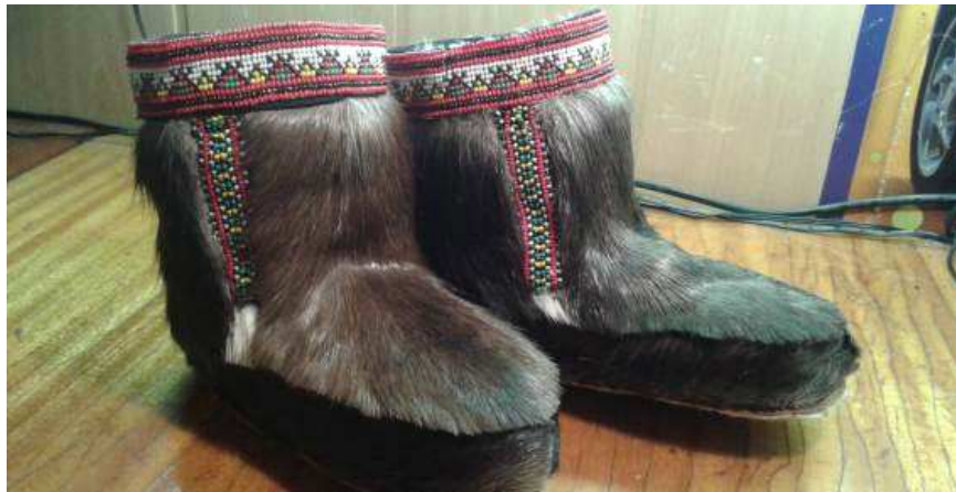
<그림 4> 케페르베엠 마을 가죽/모피 옷 제조 기업에서 만든 모피 장화 46)

2018년에 케페르베엠 가죽/모피 옷 제조 기업은 새 장비(스키닝 머신)를 구입했다. 스키닝 머신 구입으로 인해 이 기업은 자사 제품을 양산할 수 있게 되었다. 이 장비 구입은 ‘쿠폴’ 재단의 지원으로 이루어졌다(150만 루블). 47)