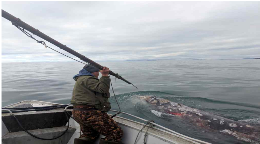
<그림 3> 추코트카 자치구에서 다틴간을 이용한 고래 사냥 모습 40)

2019년부터 해양 포유류 수렵으로 얻는 제품의 생산량은 지속적으로 증가하고 있다. 하지만 증가된 생산량은 해양 포유류 고기에 대한 원주민들의 수요를 완전히 충족시킬 수 없다. 해양 수렵 과정에서 얻은 고기는 부피가 크고 상당히 빨리 부패되기 때문에 일정한 시간이 지나면 식용으로 사용될 수 없으며 심지어 동물 사료로 사용하기에도 부적합하다.