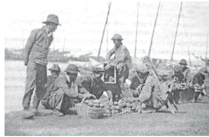
블라디보스토크 부두가 채소 판매

러시아 극동에 이주한 한인들이 토지를 얻기 위해서는 러시아정교로 개종해야만 하였다. 제정 러시아는 제정일치로 정치권력과 종교가 통일되어 있었기 때문이다. 러시아에 이주한 한인들은 러시아정교의 신자가 되어야 제정 러시아의 국적을 취득할 수 있었으며, 국적을 취득하여야 토지를 분여 받을 수 있었다(국사편찬위원회 2008, 402). 러시아정교회에 귀의한 한인 신자라 할지라도 관혼상제의 의식은 전통 혼례식을 거행하는 등 조선에서와 같았다. 러시아 국적에 편입하는 한인들의 수가 빠르게 늘어나기는 하였지만, 한인들이 러시아정교회에 귀의하는 추세는 오히려 정체되었다. 특히 연해주에 개신교가 들어온 이후 한인 신도의 수는 급격하게 증가하는데 언어 장벽이 러시아정교회와는 다르게 거의 없었던 것이 주요 원인이었던 것으로 보인다. 한인들은 본국에서 갖었던 토속신앙과 제사를 유지하는 경우가 대부분이었다.