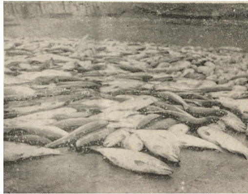
하역 후 홍연어