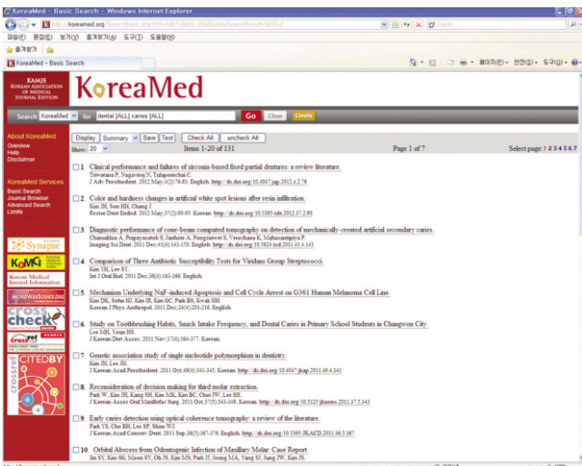
Fig. 1. KoreaMed is based on English.