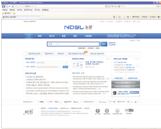
Fig. 4. NDSL has not only articles but also patents and government reports.