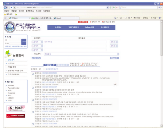
Fig. 2. KMBASE includes all Korean medical journals.

논문의 서지정보와 초록을 영어로 서비스하고 있다(Fig. 1) 6) . 이중 치의학 학술지는 11종이다. 2008년부터는 Pubmed Central에 대응되는 Synapse를 구축하여 등록학술지의 원문을 무료로 서비스하고 있다. 또한, 해외 의학 데이터베이스 등재를 돕는 활동을 펼쳐 PubMed에 59종, SCI에 23종, Scopus에 64종 등의 등재를 도왔다 9) .