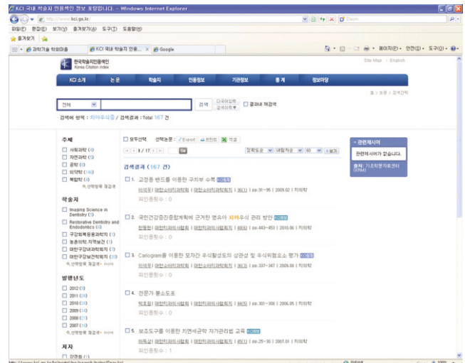
Fig. 5. KCI shows citation index per article.

전국 대학 소장자료 공동활용을 통해 약 천만건의 목록을 제공하고 있다. 총 이용자는 200여만명, 하루 평균 약 3만 8천명이 방문하고 있는 국내 최대의 학술연구정보서비스이다 13) .