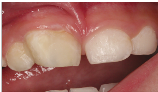
Fig. 5. Composite resin restoration. Labial and palatal grooves were sealed and crown reshaping was performed with composite resin.