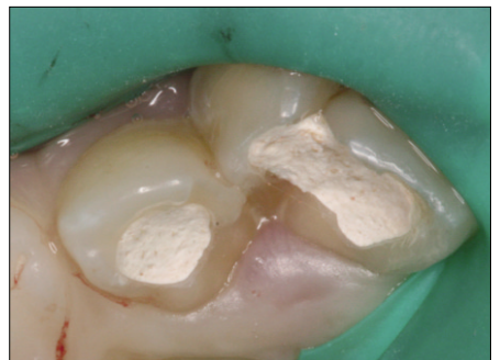
Fig. 3. Endodontic treatment procedure.