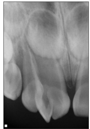
Fig. 2. Initial periapical view. An open apex and periapical radiolucency of triple tooth were observed.