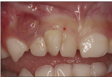
Fig. 1. Initial intraoral photograph. Abscess and fistula were observed in the region of the triple tooth.

치료 4주 후 정기검진 시 치은에 누공은 사라진 상태였으며 방사선 사진상에서 근관이 3개의 형태로 충전되어있음을 확인하였다(Fig. 4). 치아 교환기까지 약 4년 이상 남은 점을 고려하여 치관 심미 수복에 대해 제안하였으며 보호자의 동의를 얻어 치료 9주 쯤 복합레진을 이용하여 치관 형태를 성형하고 순측 및 구개측 열구를 전색하였다(Fig. 5). 이후 7개월간의 정기검진 시까지 특별한 합병증은 나타나지 않았으며 근관 충전 상태 또한 비교적 양호하게 유지되었다.