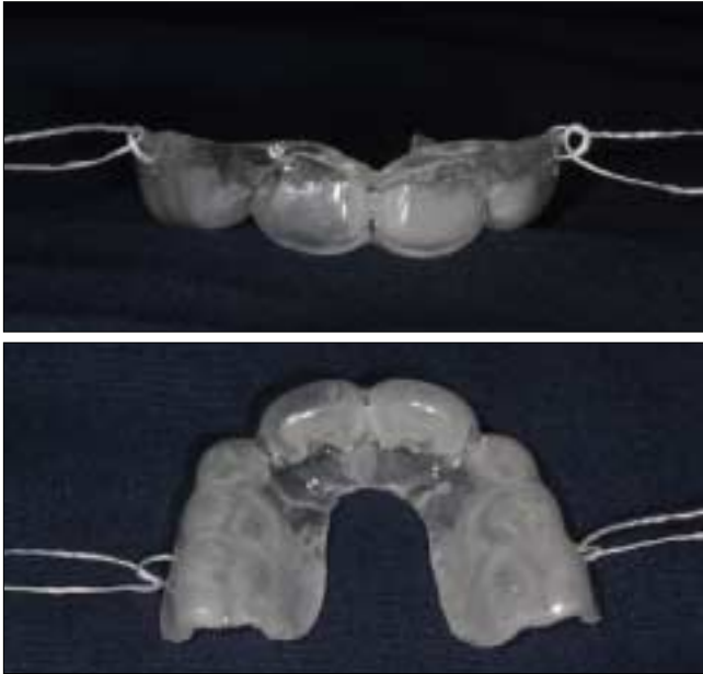
Fig. 3. Mouth guard made with polyvinyl acetate-polyethelene copolymer (PVAc-PE, EVA) which is 3 mm in thickness. Dental floss is tied between primary molars.

술을 시행하였다. 3개월(Fig. 2c) 검진 시 동요도 없었고 타진에 음성반응을 보였으며 치주인대공간의 양호한 치유양상을 보였다. 1차 인공와우 이식수술을 시행한 지 6개월 후 본원 이비인후과에서 2차 수술을 대비한 치아 검진을 위하여 본과에 의뢰하였다. 기도 삽관 시 치아의 추가적인 손상을 방지하기 위하여 외래에서 마우스가드를 제작하였다. 알지네이트를 이용하여 인상을 채득하였는데 연령에 비하여 환자의 악궁이 매우 좁고 개구량은 20 mm 가량으로 입을 크게 벌리기 힘들어 하였으므로 가장 작은 사이즈의 어린이용 트레이에 전방, 측방 경계를 왁스로 둘러 인상채득을 시행하였다. 마우스가드 제작 시에는 3 mm 두께의 열가소성 polyvinyl acetate-polyethelene copolymer(PVAc-PE, EVA) 소재로 진공성형술을 이용하여 상악에 장착하도록 제작하였다. 마우스가드의 경계는 협측 치은연 하방 2 mm, 설측 치은연 하방 5 mm, 최후방 구치의 원심연까지 연장하였다. 수술 시 쉬운 탈착을 위하여 유구치 사이에 구멍을 내고 치실을 매달았다(Fig. 3). 수술 후 시행한 6개월 검진 시 치아는 동요도 없었으며 타진에 음성반응을 보였으며 치주인대공간의 양호한 치유를 보였다(Fig. 4). 향후 3개월마다 정기검사를 시행하고 치근단이 완성될 시 거타퍼차를 이용한 근관 충전을 시행할 예정이다.