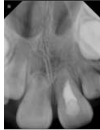
Fig. 4. Periapical view. Six months after the first cochlear implantation surgery (immediately after the second cochlear implantation surgery), the tooth showed good healing state of periodontal ligament space.

TCS는 25,000명에서 50,000명당 1명의 발생률을 보이고 남성과 여성간의 발생을 차이는 없으며 현재까지 400건이 넘게 보고되었다 5) . 2006년 da Silva Dalben 등 6) 은 15명의 TCS 환