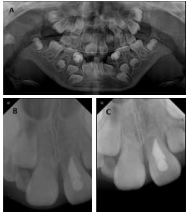
Fig. 2. Radiographic view A: Panoramic view after replantation and fixation of upper left central incisor, B: Eight weeks after, pulp was extirpated and canal was filled with calcium hydroxide. Resin wire splint was removed, C: Three months later, the tooth showed no mobility, negative response to percussion and good healing state of periodontal ligament space.

hearing aid)를 사용하였으며 생후 1년이 되었을 때 본원 성형외과에서 구개성형술(palatoplasty)을 시행하였다. 만 6세 경인 2012년 1월, 선천성 외이도 폐쇄증 진단 하에 본원 이비인후과에서 인공와우 이식수술을 위한 전신마취를 시행하였다. 기도 삽관을 위하여 직접후두경 사용하였으나 삽관에 실패하여 후두마스크를 통한 굴곡후두경을 이용하였으며 직접후두경 사용시 상악 좌측 중절치가 완전 탈구되었다. 완전 탈구된 치아는 생리 식염수에 보관되었으며 탈구된 지 4시간 경과 후 본원 소아치과에 외래로 내원하였다. 환아의 지능은 정상으로 협조도가 높았으며 안모는 전형적인 TCS환자의 특징을 보였다(Fig. 1). 작고 후퇴된 하악골로 인한 전방 개교를 보였으며 상악골 너비의 저성장으로 구치부 반대 교합을 보이고 있었다. 완전 탈구된 상악 좌측 중절치는 Nolla's stage 7에 해당하였으며 특기할만한 치아이형성은 보이지 않았고 그 외 치아의 수와 형태에 비정상적인 소견은 보이지 않았다. 해당 부위의 국소 마취 하에 생리식염수로 치조와를 세척한 후 치아를 재위치 시키고 0.5 mm 스테인리스스틸 와이어를 이용한 레진 강선 고정술을 시행하였다(Fig. 2a). 8주 후(Fig. 2b) 검진 시 상악 좌측 중절치는 타진에 음성반응을 보였으며 냉자극 검사, 전기치수검사에 반응하지 않았다. 해당 치아의 발수를 시행하고 레진 강선 고정술을 제거하였으며 칼슘하이드록사이드를 이용한 치근단형성