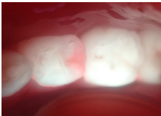
Fig. 2. Semilunar shaped red fluorescence is observed at the distal surface of mandibular right first primary molar which indicates progression of proximal caries into the dentin. The image was captured with macro lens, SURPASS-i (YuSangtech, Bucheon, South Korea) mounted to the iPhone (Apple, Cupertino, USA).

Q-ray view는 실제 임상에서 치아우식증을 확인하는 목적으로 사용되고 있으나 현재까지 Q-ray view를 이용한 유구치 인접면의 우식증 탐지에 대한 연구는 이루어지지 않은 실정이다.