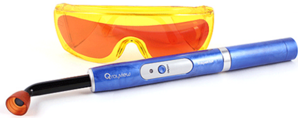
Fig. 1. Q-ray view is composed of goggle and device which emits visible blue light.

인접면 우식증을 탐지하는 데 도움을 줄 수 있는 간편하고 신뢰성 있는 장비 개발의 필요성이 대두되고 있는 가운데, 2012년도에 국내에서 Q-ray view (All in one Bio, Seoul, Korea)가 개발되었다(Fig. 1). 이 장비는 Quantitative Light-induced Fluorescence (QLF)의 원리를 이용하며 술자가 특수 필터가 내장된 고글을 착용하고 치아에 405 nm 파장의 푸른색 가시광선을 조사할 경우, 세균의 대사 산물인 porphyrin이 존재하는 우식 부위, 오래된 치태 또는 치석이 존재하는 곳에서 붉은색 형광을 관찰할 수 있다(Fig. 2) 10-12) .