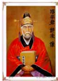
图 1 医圣 许浚 像