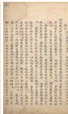
그림 2. 제1권 목록