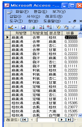
그림 2. 방제의 각 효능별 본초 비율의 평균

방제학 교재에 기재된 방제의 효능에 근거하여 특정 효능을 가진 방제에서 개별 본초의 비율 정보 8) 를 추출한다.