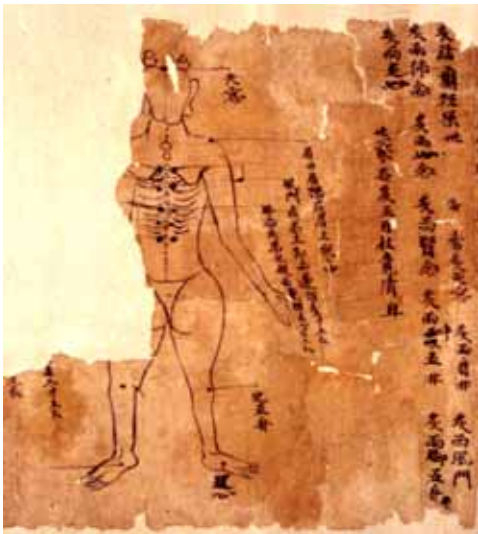
그림 6. 敦煌卷子. 天窗, 肩井, 风门, 肺俞.

癫狂二三十年者,灸天窗,次肩井,次风门,次肝俞,次肾俞,次手心主,次曲池,次足五趾,次涌泉,各五百壮,日七壮(『千金翼方·针灸中』卷二十七)。