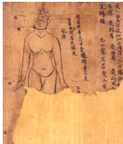
그림 2. 敦煌卷子. 板眉, 曲眉, 风府.

面上游风如虫行习习然, 起则头旋眼暗, 头中沟垄起, 灸天窗, 次两肩上一寸当瞳仁, 次曲眉在两眉间, 次手阳明, 次足阳明, 各灸二百壮(『千金翼方』).