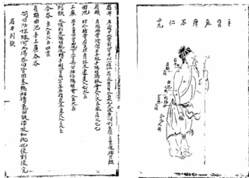
그림 8. 元代针灸集成的明初节录本.

第一, 敦煌卷子『佚名灸方』所录每一灸方下均据明堂文献详注其穴, 特别是该抄本每一灸方下皆附有灸穴图, 颇便于临床取穴。这种特殊的体例对后世的针灸方书的编纂也产生了一定的影响, 例如元代『针灸集成』的明初节录本(见图8), 明代的『针灸捷径』(见图9), 『针灸全书』(见图10)等皆用此例。