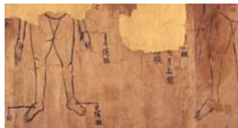
그림 3. 敦煌卷子. 手阳明, 足阳明.

以上敦煌卷子此条灸方脱文, 错字较多, 当据『千金翼方』补正; 另一方面据敦煌卷子灸方及附图(见图2)可知, 『千金翼方』此方中第二穴前脱穴名“板眉”, 当据补. 又据该穴名及附图所标之部位, 可知『千金翼方』