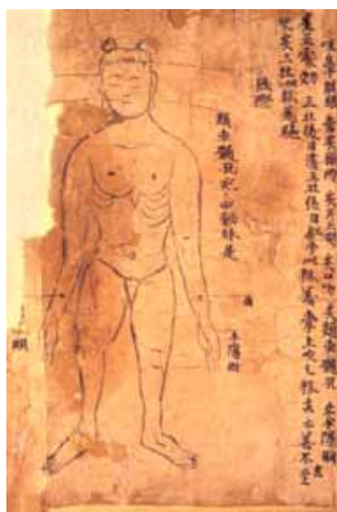
그림 11. 敦煌卷子. 頰車.

『佚名灸方』灸方除了敦煌卷子外, 只见于『千金翼方』, 而后者注穴的规律是: 凡不见于『明堂本经』的穴, 注其部位所在。这与我们今天的规则相同: 只注经外奇穴和新穴的部位, 经穴部位则众人皆知而不出注。可是敦煌残卷『佚名灸方』的前后体例不统一, 有些图下详注腧穴的部位, 主治病症及灸疗法, 却不见相应的灸方。因此不能排除这样的可能性: 敦煌残卷是两种文献, 一种是见于『千金翼方』的不知名的灸方, 另一种见于『千金要方』和『千金翼方』的不知名的腧穴文献——灸经明堂。