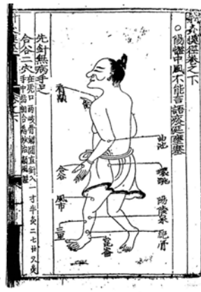
그림 9. 明代的针灸捷径.