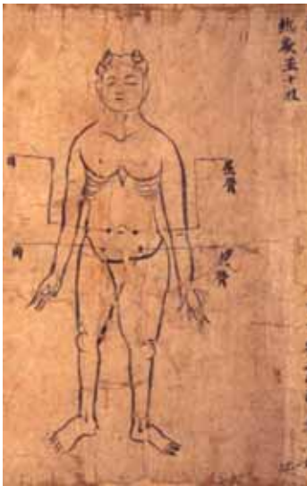
그림 1. 敦煌卷子. 屈骨, 横骨.

夹屈骨相去五寸名水道, 主三焦, 膀胱, 肾中热气, 随年壮(『千金翼方·针灸中』卷二十七).