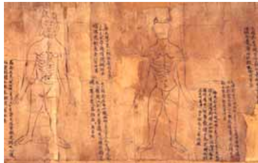
그림 5. 敦煌卷子. 小腸俞, 大小腸俞.

大肠输在十六椎两边相去一寸半。治风，腹中雷鸣，肠癖泄痢，食不消化，小腹绞痛，腰脊疼强，或大小便难，不能饮食，灸百壮，三日一报之(『千金要方·诸风』卷八)。