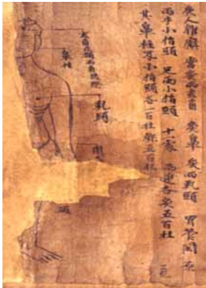
그림 4 敦煌卷子. 玄角, 鼻柱, 乳頭, 関原, 小指頭

值得注意的是，此方中“足阳明”，“手阳明”二穴，并非以往人们想当然地理解为经脉名称，而是经穴名，其部位皆相当于脉口处。其中“足阳明”穴，原方穴图虽残缺，但在另一图中确有清楚的标注(见图3)，相当于足阳明脉口——冲阳脉处。另该卷有三幅图均标注了“手阳明”穴名，均相当于手阳明脉口——阳溪穴处。