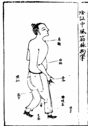
그림 10. 针灸全书.

第二, 由于此书所取之穴皆有文有图, 对于今人辨识“经脉穴”及某些“同名异穴”及“异名同穴”等疑难问题也提供了形象, 可靠的依据。例如现存灸方残卷共包含三个“经脉穴”: 手阳明, 足阳明, 足太阳, 由于此卷子穴图对于腧穴的具体部位有明确的标注, 一目了然, 从而对于“经脉穴”源流的考察提供了重要史料; 又如“天窗”既是颈部手太阳经穴名, 又是头部督脉穴“囟会”穴的别名, 以往由于不知此变故, 而将隋唐时期针灸方中头部督脉穴“天窗”都错误地理解成颈部手太阳经穴, 今依据卷子灸穴图, 并结合传世相关史料, 可以使得针灸史上这类疑难问题涣然冰释。