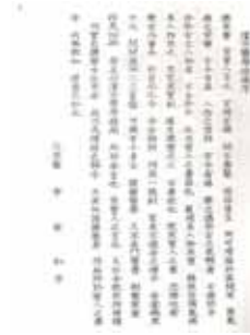
그림 3. 『漢方醫學指南』序文

다” 11) 고 하여 이전에 古今異軌說이 있었지만 궁극적으로 본질을 추구해보면 그 이치가 같다고 보았다. 따라서 옛것을 인용함에 있어서 늘이거나 줄이지 않았다.